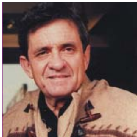
Johnny Cash 1932-2003.

Cashs sång What On Earth Will You Do For Heaven's Sake (Vad vill du göra på jorden för himlens skull) från 1974 handlar om hur