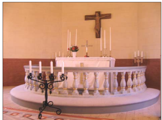
Översta bilden visar en vy mot koret. Och den nedre är en detaljbild över altaret.

Sakristian har ett trägolv och är disponerad med ett förrum mot kyrkorummet varifrån trappan till predikstolen går. Väggarna utgörs av synligt timmer som målats i grått. Taket är klätt med panel målade lika som väggarna. Dörrarna utgörs av gråmålade fyllningsdörrar.