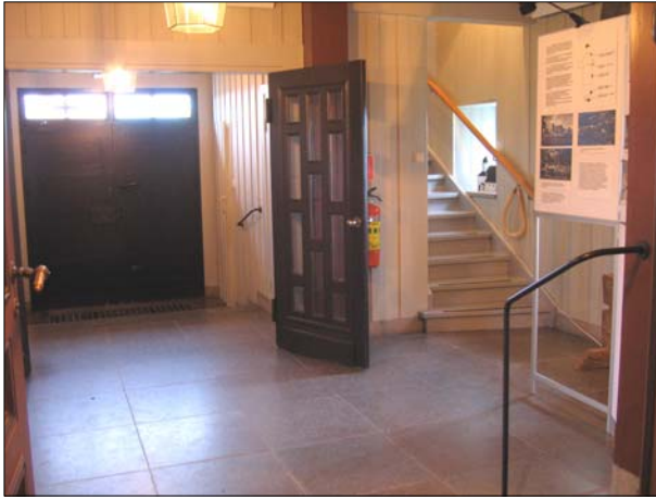
Vy över vapenhuset mot trappan till tornet och orgelläktaren.

målade i en ljusgrå/varmvit kulör. Mot vapenhuset sitter en rödmålad pardörr och till sakristian sitter en enkel gråmålad fyllningsdörr.