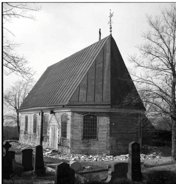
Kyrkan från sydöst. Tornet nedtaget, reveteringen avlägsnad. Under restaurering 1953.

Invändigt önskade Erichs att totalt rensa ut kyrkorummet från all inredning men detta bromsades av myndigheterna. Den öppna bänkinredningen plockades bort och timmerväggarna frilades från pärlspåntpanelen. En ny sluten bänkinredning utfördes med enkla fyllningar utan dekorationer. I koret plockades altartavlan ned och det medeltida krucifixet monterades som altarprydnad efter att det konserverats av konservator Sven Wahlgren. Under arbetena i kyrkan påträffades dekorativ måleri från 1700-talet på läktarbarriären vilket plockades fram, den gamla orgeln dömdes ut och en ny tillverkades av den danska orgelfirman Fredriksborgs Orgelbyggeri. Kyrkan moderniserades även genom att elektrisk belysning och värme installerades.