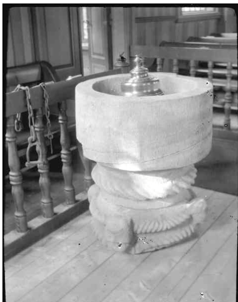
Dopfunten av sandsten, äldre medeltid. I bakgrunden syns den öppna bänkinredningen som tillkom vid 1890 års restaurering.

tillkom under perioden 1766-67 då klockstapeln revs och uppfördes såsom torn vid kyrkans västra gavel. Inne i tornet syns den äldre spånbeklädnaden bevarad på långhusets västra gavelröste. I början av 1800-talet upplevdes kyrkan som trångbodd och en utvidgning mot öster utfördes. Vid det tillfället ansågs Falks dekorativa måleri som undermåligt och kyrkorummet ommålades med ljusa väggar och himmelsblått tak. En ny predikstol och altartavla tillkom, altartavlan målades direkt på panel av en målare vid namn Lundin.