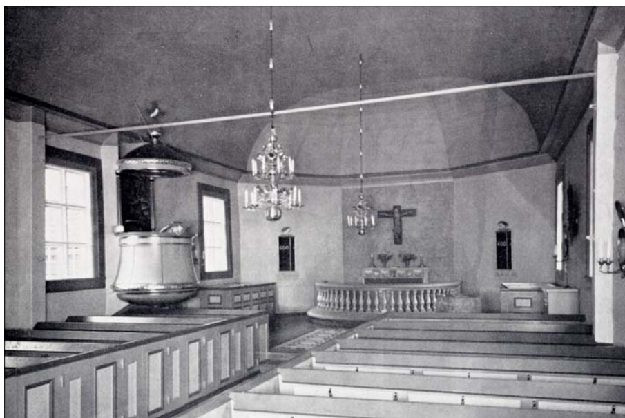
Kyrkorummet som det tog sig uttryck efter restaureringen på 1950-talet.

1987-88 gjordes en utvändig restaurering under ledning av Sven Samuelssons Byggnadsfirma i Tranås. Arbetena omfattade både fasad- och målningsarbeten. När kyrkan åter spånbekläts under 1950-talet hade utförandet haft sådana brister att delar av täckningen nu behövde ersättas. På långskeppet och absidens takytor lades ny spånbeläggning, i övrigt gjordes enbart kompletteringar av den befintliga spåntäckningen. Snickerierna rengjordes och målades med linoljefärg. Den utvändiga restaureringen följdes i mitten av 1990-talet av en genomgripande inre restaurering som syftade att förstärka känslan kyrkorummets 1700-talsuttryck.