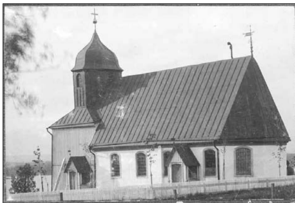
Kyrkan från söder innan omdaningen 1953. Foto P A Eriksen okänt datum. (ATA)

Det finns få uppgifter rörande Bondstorps tidiga kyrkobyggnader. Det är klarlagt att den nuvarande kyrkan föregåtts av åtminstone en tidigare kyrkobyggnad. 1693 var den dåvarande kyrkan i så dålig kondition att det beslutades om dess rivning. En ny kyrka uppfördes under åren 1694-95 och utfördes med spånklädd timmerstomme. Kyrkan hade då en fristående klockstapel i vilken kyrkklockorna var placerade. 1711 bemålades kyrkorummet av målaren Anders Falk från Ulricehamn. Han målade interiören med sedvanliga himmel- och helvetesscener. Tornet