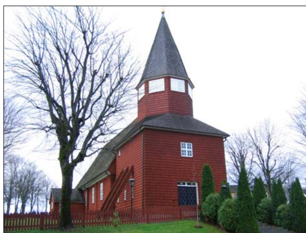
Västfasaden med tornet i den utformning som det fick efter 1953.

Bondstorps kyrka har en enskeppig planform med östvästlig orientering. I väster är ett torn vidbyggt kyrkobyggnaden och i norr är sakristian belägen. Stommen är timrad och spånbeklädd till sina fasader och takytor. Fönsteröppningarna är tätspröjsade med rektangulär form, fönstersnickerierna är vitmålade. Det finns två entréer till kyrkan, en direktentré till sakristian samt den västliga huvudentrén genom tornet. Portarna är panelklädda och tjärstrukna, tornentrén är försett med ett mindre överljus. Foder, och taksprång är vitmålade lika som fönstersnickerierna. Tornet har formen av en inbyggd klockstapel med inklädda stödben. Tornbyggnaden kröns av en spetsig spira, ljudöppningarna är panelklädda och vitmålade.