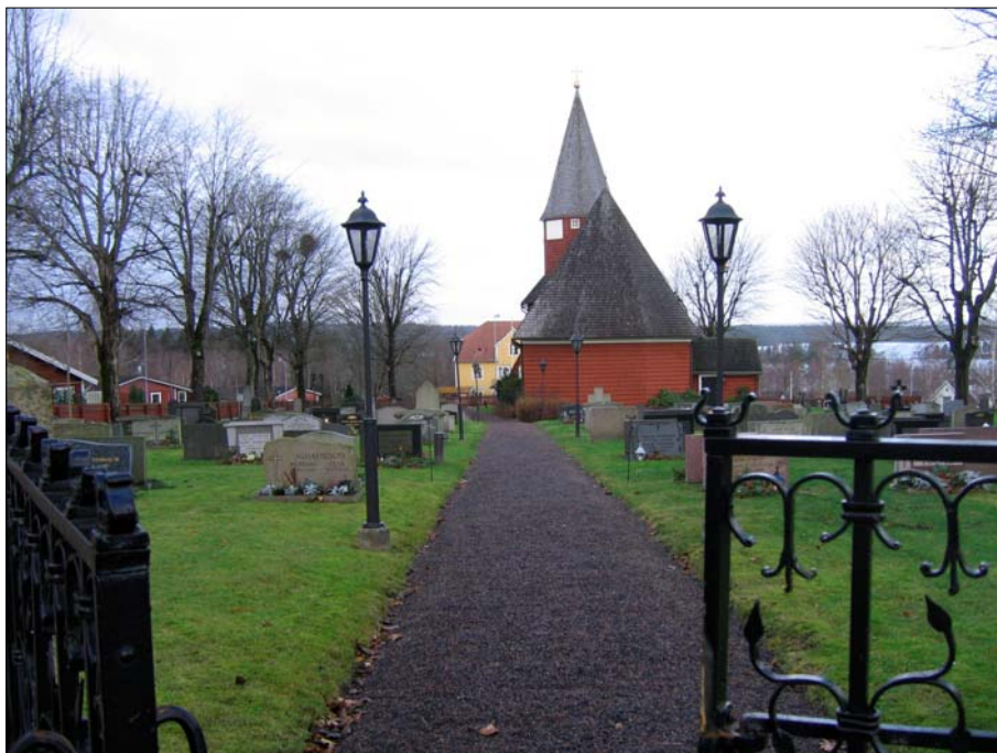
En vy över kyrkomiljön visar kyrkans läge med utsikt över den intilliggande sjön.

Bondstorps socken är belägen på höglandets sydvästra sluttning. Kyrkobyggnaden ligger höglänt med utsikt över den intilliggande Rasjön. Inom området har återfunnits få fornynd men de som hittats härrör från äldre järnåldern. Järnhanteringen utgjorde under 1600- och 1700-talen en betydande näring inom regionen och en masugn anlades 1726. Kyrkan har en central placering i byn och bland den angränsande bebyggelsen hittas prästgården i senempire, skolbyggnaden från 1890 och ett missionshus uppfört 1935. Kyrkogården har utvidgats vid tillfällen. Den avgränsas med en naturstensavbalkning och domineras av öppna gräsytor med grusade och stensatta gångar och spridda träd. Ett enkelt trästaket inramar kyrkomiljön.