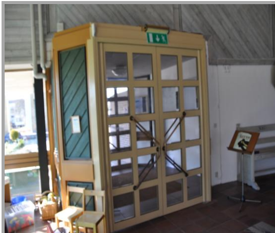
Renovering av orgel i Slottskyrkan

Byte av utrymningskyltar samt installation av digitalt låssystem i Birgitta kyrkan