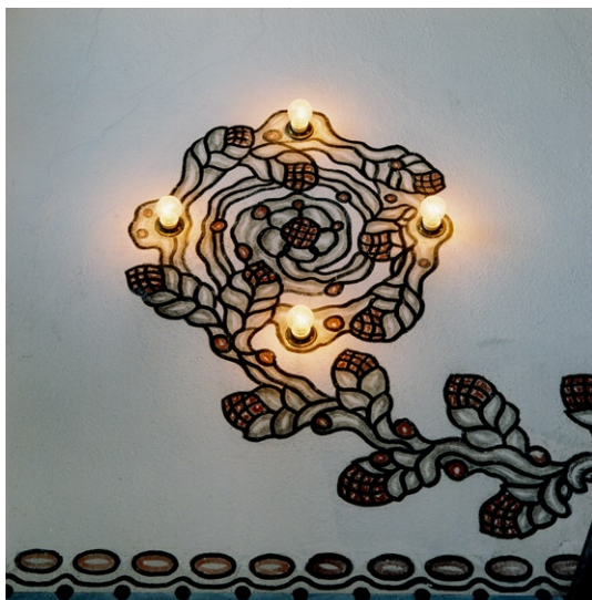
Dekormåleri med armaturer i form av nakna glödlampor.

och i triumfbågen . I triumfbågens dekor är nakna glödlampor inkomponerade på var sida om koret. Över pardörren mot vindfånget i nordväst är två hjortar målade och texten ”Så som