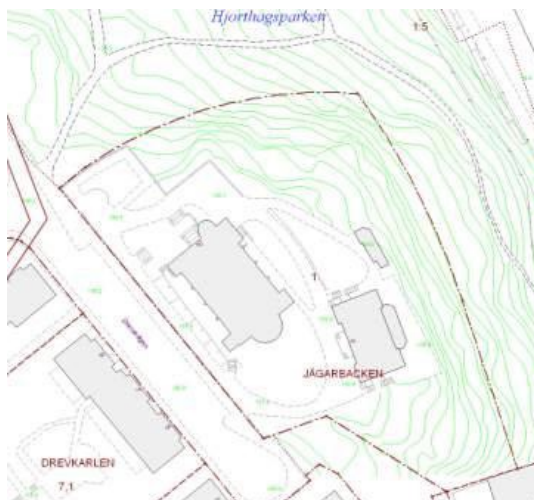
Utsnitt ur Stockholms stadsbyggnadskontors baskarta 2007.