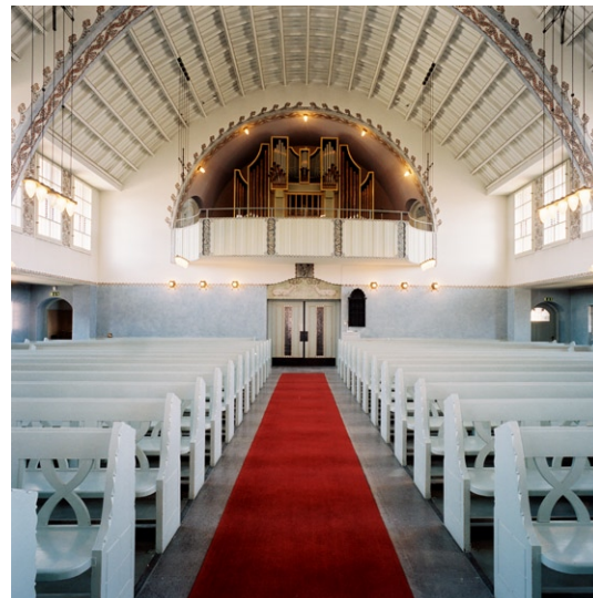
Kyrkorummet mot orgelläktaren.

En uppsättning nattvardskärl i förgyllt silver skänktes till kyrkan 1909, tillverkade av K An-