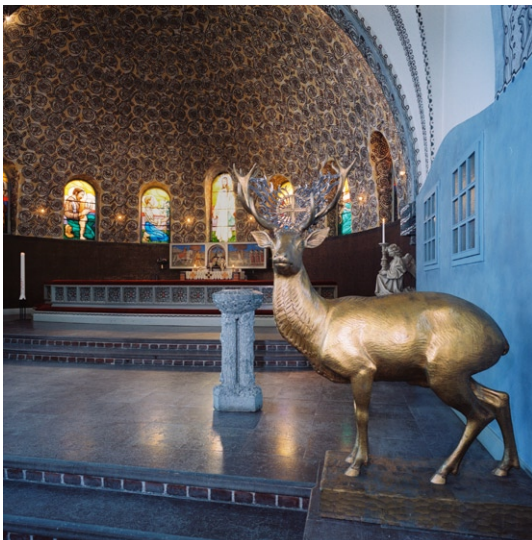
Koret med en Hubertushjort i förgrunden och dopfunten i mitten av bilden.

Dopfunten av täljsten har formen av tre trästammar vilka bär upp en cuppa med lövverk i relief, utförd av bildhuggaren N Arthur Sandin. På triumfbågens västra sida står en skulpterad Hubertushjort av förgyllt trä modellerad av Tore Strindberg och skuren av träsnidaren Per Kers 1910. På barriären till predikstolen står ett votivskepp målat i guldfärg och utfört av en sjöman. Två änglar av gips, gjorda i Italien, står på var sida om absiden .