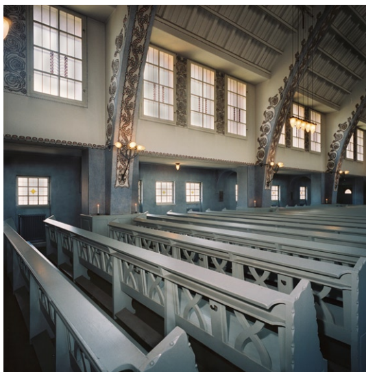
Kyrkorummet mot det östra sidoskeppet.

och i triumfbågen . I triumfbågens dekor är nakna glödlampor inkomponerade på var sida om koret. Över pardörren mot vindfånget i nordväst är två hjortar målade och texten ”Så som