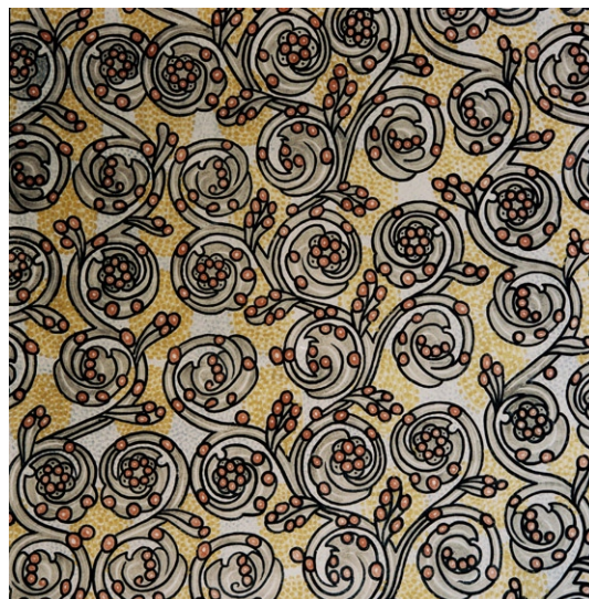
Dekormåleri i ko ret.

Koret med halvkupoltäckt absid är smalare än långhuset, har lägre takhöjd och betydligt mindre ljusinsläpp. I absiden sitter sju relativt små rundbågiga fönster i djupa nischer. Det i mitten är högre än de andra och alla har figurativa glasmålningar i starka färger, med Jesus i centrum. Kartongerna till dessa utfördes av målaren Eigil Schwab.