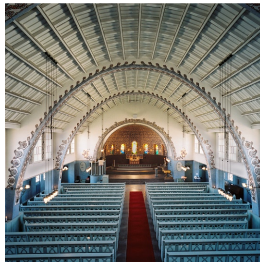
Kyrkorummet mot koret.