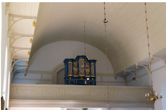
Läktaren och orgeln från öster.

Näsman, mellanklockan skänktes 1954 av Ställbergs gruvaktiebolag och lillklockan göts 1735 av Gerhard Meijer i Stockholm. Den största och minsta klockan har hängt i gamla kapellet klockstapel.