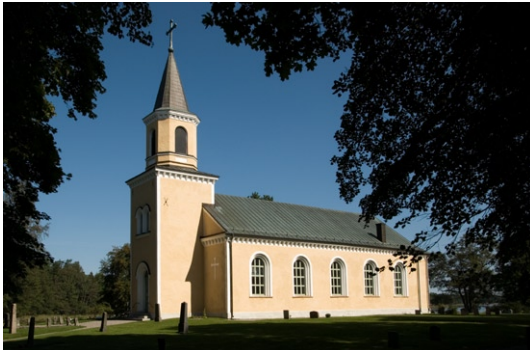
Exteriör från sydväst.

gar, takfot och murhörn. Under takfoten på långhus , sakristia och torn är dekorativa lister. Fönster- och dörröppningarna är rundbågiga med trespråkiga omfattningar. Fönsteröppningarna är försedda med träkarmar vari flera öppningsbara bågar sitter. Entrén till kyrkan är belägen i tornets västgavel som är försedd med en pardörr med halvmåneformat överljusfönster. Dörrbladen har fyra fyllningar vardera och helfranska lister. Dörr- och fönstersnickerier är grönmålade. Sakristian har en paneldörr från 1946. Taken är belagda med kopparplåt, både tornets mångsidiga lanternin , kyrkorummets sadeltak och sakristians snedtak. Tornspiran kröns av ett kopparkors.