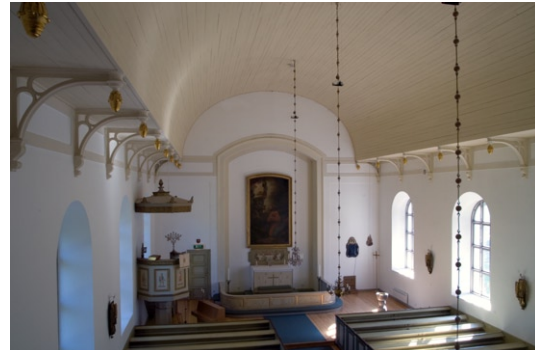
Interiör från väster.

Trägolven i kyrkan är lackade. Väggarna är putsade och vitmålade med beige ramar runt väggfält mellan konsoler. Vid en renovering 1946 målades väggfältens dekorativa målningar över och de tidigare synliga takstolarna av gjutjärn täcktes in med ett trätunnvalv . Trätunnvalvet är beigemålade och den öppna bänkinredningen är laserad i grågröna toner med brunmålade överliggare.