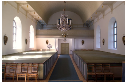
Interiör från öster.

Tornets bottenvåning tjänstgör som kyrkans vapenhus . I klockvåningen, till vilken man kommer via orgelläktaren, hänger tre klockor. Storklockan göts 1728 i Stockholm av Erik