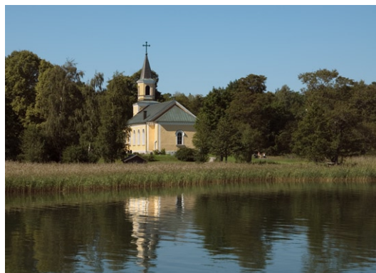
Exteriör från Kyrkviken, sydöst.

Kyrkans sockel är av huggen natursten. Fasaderna är spritputsade och avfärgade i ljus gul med vita, slätputsade fönsteromfattningar, smy-