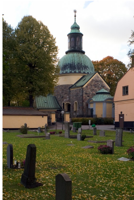
Exteriör från öster.

fönsternischer är slätputsade och avfärgade i brunockra och fönstersnickerierna är målade i ekimiterande färg, senast 2000. Samtliga tak är täckta med kopparplåt.