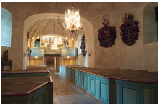
Interiör mot väster.

Genom glasade, svängdörrar kommer man in i kyrkorummets långhus med mittgång av kalksten och numera sex stycken infällda gravhällar. Några flyttades till koret 1928. Till de ovanligare hör en gravhäll av kalksten från