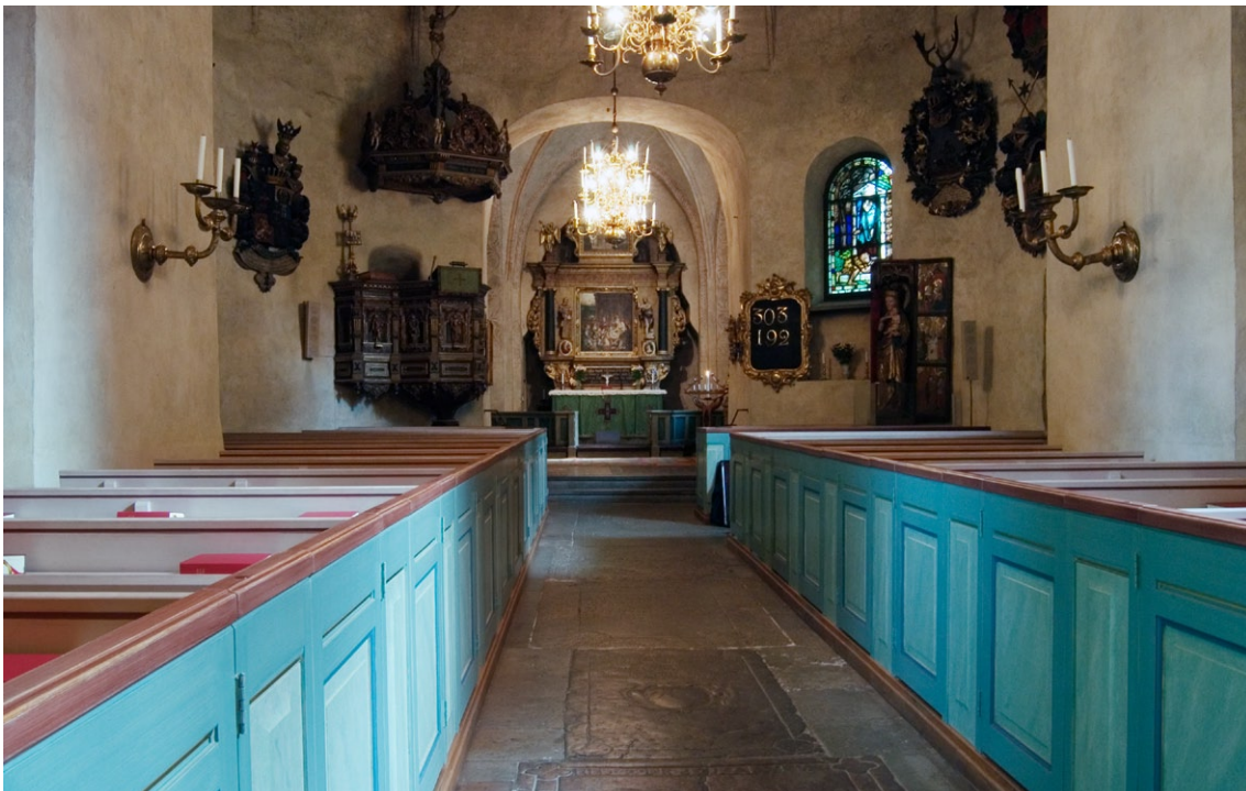
Interiör mot öster.

Predikstolen är snidad i trä med ursprunglig polykromi i gråvitt, rött, blått och guld, framtagen 1928. I korgens nischer står statyetter som föreställer Kristus och de fyra evangelisterna . Ljudtaket, som kröns av Kristus med segerfana , bär de la Gardies, Pfalz', Gyllenhielms och Ribbings vapen samt inskriften "Anno 1674". Predikstolen är skänkt av Magnus Gabriel de la Gardie och möjligen utförd av bildhuggaren