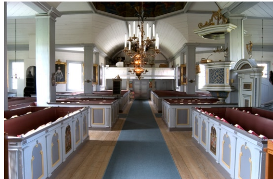
Kyrkorummet åt väster.