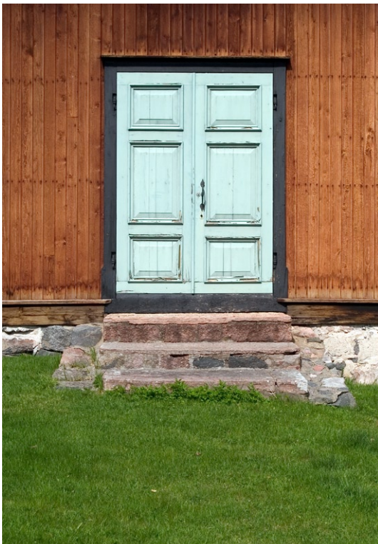
Södra korsarmens pardörrar.

delning. Den profilerade taklisten, fönsterfoder och fotlisten är målade i svart. Fönstersnickeriernas vitmålade, småspröjsade träbågar sattes in 1925.