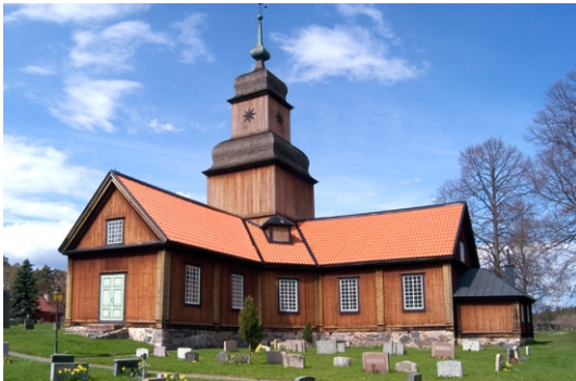
Roslags-Kulla kyrka från sydöst.

delning. Den profilerade taklisten, fönsterfoder och fotlisten är målade i svart. Fönstersnickeriernas vitmålade, småspröjsade träbågar sattes in 1925.