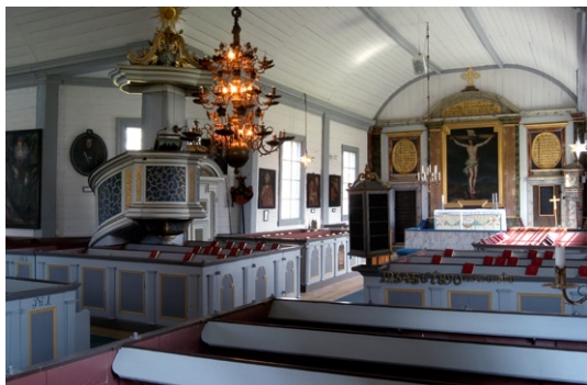
Kyrkorummet åt nordost.

tartavlan, som är ursprunglig, utgörs av en oljemålning som framställer Kristus på korset, infattad mellan kannelerade , marmoreringsmålade pilastrar som bär en segmentformig korskrönt gavel. Segmentbågen är marmoreringsmålad i vitt-grått med förgyllningar. Sakristians dörr ingår i alturväggens uppbyggnad och har kraftiga, vitgrå marmoreringsmålade dörrfoder. Dörren söder om altaret är en målad blinddörr. Sakristians dörr har fyra utanpåliggande fyllningar och en inre järnbeslagen dörr försedd med tre stora smidesläs. Över dörrarna återfinns medaljonger infattade i marmoreringsmålade ramar varav den ena är försedd med bibelspråk och den andra med text som erinrar om kyrkans byggherre