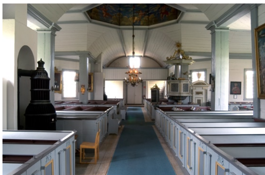
Kyrkorummet åt norr.

tartavlan, som är ursprunglig, utgörs av en oljemålning som framställer Kristus på korset, infattad mellan kannelerade , marmoreringsmålade pilastrar som bär en segmentformig korskrönt gavel. Segmentbågen är marmoreringsmålad i vitt-grått med förgyllningar. Sakristians dörr ingår i alturväggens uppbyggnad och har kraftiga, vitgrå marmoreringsmålade dörrfoder. Dörren söder om altaret är en målad blinddörr. Sakristians dörr har fyra utanpåliggande fyllningar och en inre järnbeslagen dörr försedd med tre stora smidesläs. Över dörrarna återfinns medaljonger infattade i marmoreringsmålade ramar varav den ena är försedd med bibelspråk och den andra med text som erinrar om kyrkans byggherre