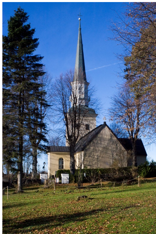
Exteriör från öster.

Ekerö kyrka är i dag en salkyrka med två korsarmar, eller en långsträckt korskyrka, med ett medeltida västtorn. Tornet avslutas av en yngre