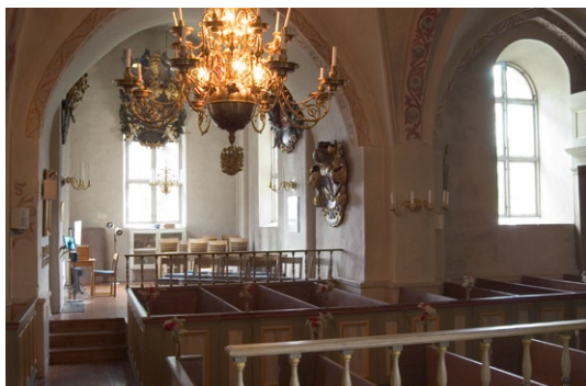
Interiör mot södra korsarmen.

Möjligtvis utförde Nikodemus Tessin d y ritningarna till korsarmarna, åtminstone medverkade han vid det norra gravkorets välvning. De båda gravkoren täcks av enkla och ribblösa kryssvalv , och väggar och valv är avfärgade i vit kulör. Det södra gravkoret pryds och domineras framförallt av tre stora begravningsvapen . Sedan 1990-talet är det södra gravkoret inrett för enskild andakt, och kallas Ingeborgskapellet. I det förvaras en gravhäll från 1100-talets slut med runristad latinsk inskrift.