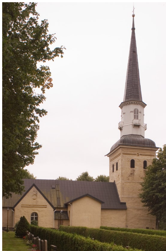
Exteriör mot norr.

1941 utvidgades kyrkogården åt norr. Den yngre delen omgärdas av en bogårdsmur uppförd av sprängd gråsten. Den äldre kyrkogårdens entréer mot väster och öster flankeras av