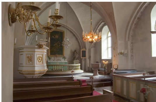
Koret i öster.

1880–81 genomfördes en större renovering i kyrkan. Förutom tidigare nämnda åtgärder, försågs kyrkan med ny inredning. Från denna epok härstammar ännu altarbordet och altarringen