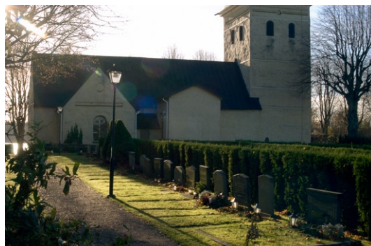
Exteriör från norr.

putsade grindstolpar, tillkomna under 1830-talet. Vid samma tid företogs omfattande planteringar på kyrkogården av framförallt av lönn