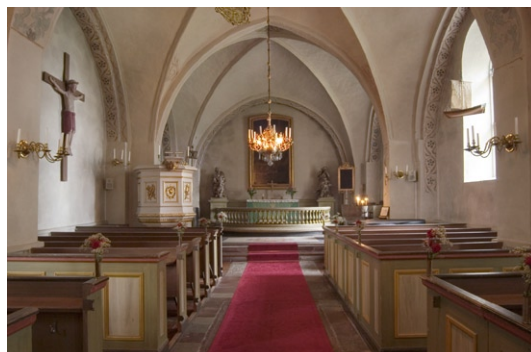
Interiör mot öster.

Tidigare var kor ets och långhus ets alla väggar och valv täckta med kalkmålningar. De överkalkades under 1680-talet. I samband med en renovering 1932–33 under ledning av Ragnar Östberg, togs fragmentariska delar av målningarna åter fram, andra rekonstruerades delvis av konservator Sven Dalén. De medeltida målningarna visar på viss släktskap med Albertus Pictors skola.