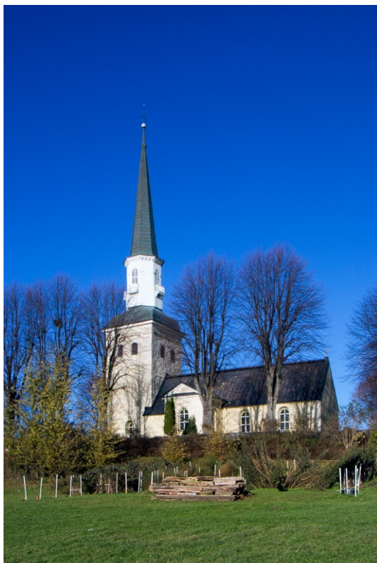
Exteriör från söder.

och lind. Av dessa träd finns ännu flera bevarade och bildar en sammanhållande trädkrans. Kyrkogården utvidgades senast mot väster, och här finns även en minneslund.