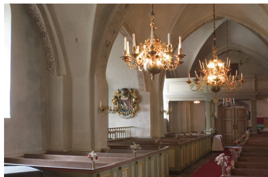
Interiör mot väster..

med svarvade balusterdockor . Altartavlan, som föreställer Kristus i Getsemane, målades under 1600-talets andra hälft, men renoverades hårt under 1700-talet.