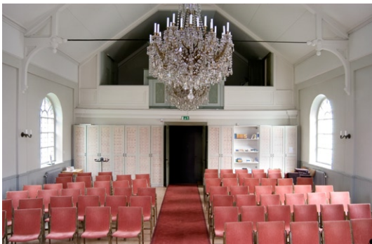
Alby kyrka, interiör mot orgelläktaren i väster.

Altarringen och predikstolen hör till kyrkorummets äldsta inredning och anskaffades när kapellstiftelsen tog över kyrkan, under 1910-talet. Sannolikt tillkom altaret under samma tid.