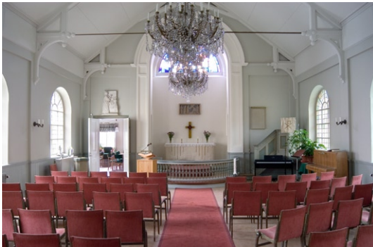
Alby kyrka, interiör mot koret i öster.

Golvet är belagt med linoleum. Koret , som är något inskjutet i en nisch, markeras med en putsad triumfbåge . I nischens övre del finns ett stort lunettfönster med en glasmålning, som tillkom 1957 av José Samson. Glasmålningen föreställer ”Det himmelska Jerusalem med dess tolv stadsportar, livsträdet och strömmen av livets vatten”. José Samson är en konstnär med anknytning till Sundbyberg som gjort utsmyckningar i flera av kommunens kyrkor, bland annat i Hallonbergen.