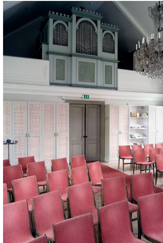
Alby kyrka, interiör med orgeln.

Altarringen , som är uppbyggd med en balustrad, kan dock vara äldre och övertogs i så fall begagnad. Predikstolen i söder dekorerats med enkla ramar. Kyrksalen är inredd med lösa stolar av betsad björk från 1950-talet. På orgelläktaren i väster står orgeln som inköptes från Lettland 2004. Till det gamla orgelverket uppfördes en ny orgelfasad. 2002 försågs kyrkorummet med flera skåp under läktaren.