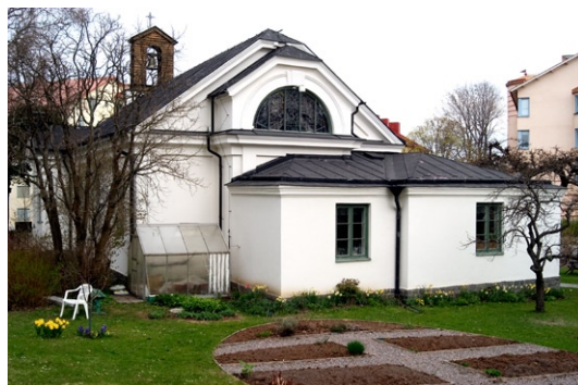
Kyrkan från öster och del av kyrkotomten.