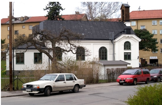
Exteriör från norr.

Kyrkan ligger i öst-västlig riktning. Exteriört kan kyrkan uppfattas som en korskyrka med de utstående gavelpartierna för de rum som tidigare inrymde vaktmästarbostad, numera sakristia och toalett. Själva kyrkorummet är uppfört som en salkyrka med rakt avslutad altarvägg. Kyrkans östra del med samlingsal har tillkommit sekundärt. Här fanns även sakristian innan den inreddes vid entrén i väster.