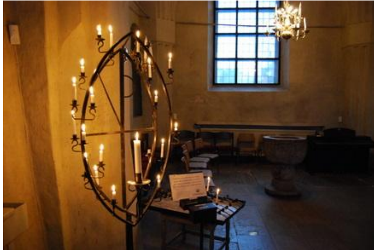
Ljusbäraren är formad efter klostersistillet

Så är nu vår vandring slut och vi står återigen framför porten. Ändå finns det en sak som inte har nämnts, nämligen offerljusstaken. Att tända ljus i kyrkan är mer en katolsk än en protestantisk sedvänja och det dröjde länge innan ljusbärarna kom tillbaka till kyrkorna. Den här ljusbäraren ser annorlunda ut, för den har samma form som klostersistillet en gång hade. (En nyare ljusbärare har senare införskaffats) I den kan de som vill tända ett ljus och sända en varm tanke eller bön till någon som behöver det.