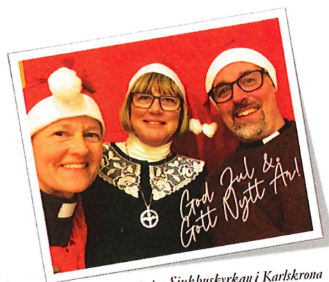
önskar Sjukhuskyrkan i Karlskrona ~ 2025 ~