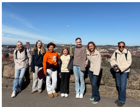
Utsikt från Masthuggskyrkan

Efter Hagakyrkan var det dags för dagens träningspass uppför trapporna till Masthuggskyrkan. ”Barnmisshandling”, ropade någon under den mödosamma