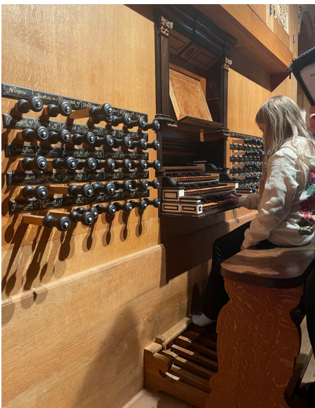
Orgeln i Örgryte kyrka

Därefter fick eleverna möjlighet att spela på domkyrkans orgel, en möjlighet som för många blev dagens höjdpunkt!