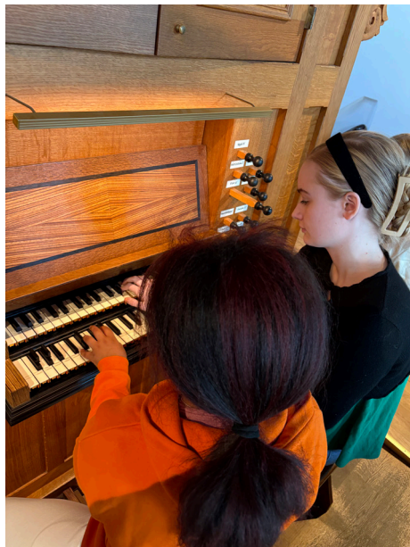
Improvisation i Hagakyrkan

På sidoläktaren finns ytterligare en orgel som eleverna improviserade på tillsammans. Den är byggd på 1990-talet, men efterliknar hur orgeln såg ut och lät under 1600-talet under den musikaliska epoken barocken.