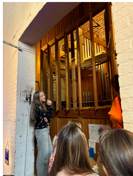
Vad gömmer sig i koret om inte orgelpipor?!