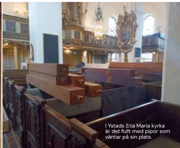
I Ystads S:ta Maria kyrka är det fullt med pipor som väntar på sin plats.