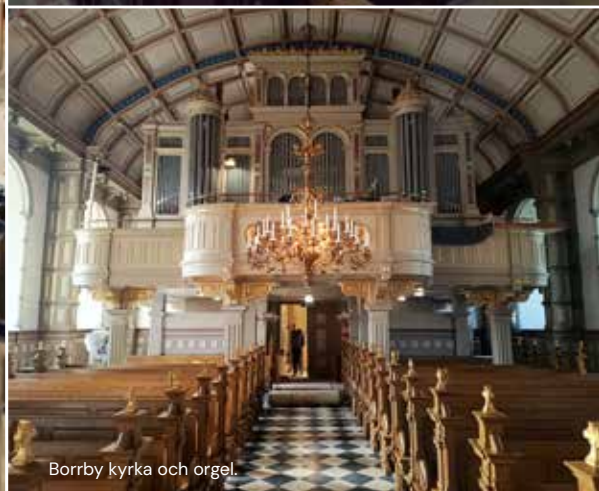
Borrby kyrka och orgel.