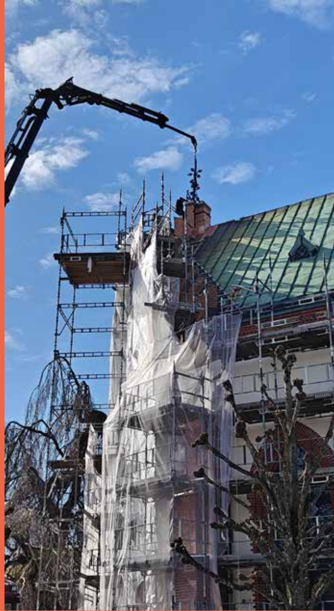
Sista vindflöjeln kunde sättas på plats i slutet av april.

OCH NÄR DU LÄSER DETTA är förhoppningsvis alla ställningar borta. Det tog minst ett halvår längre tid med den yttre renoveringen än vad det var tänkt. Det uppdagades flera allvarliga brister som måste lagas och det kunde inte göras så länge vädret var så kallt. Nu kan vi njuta av den nyrenoverade fasaden!