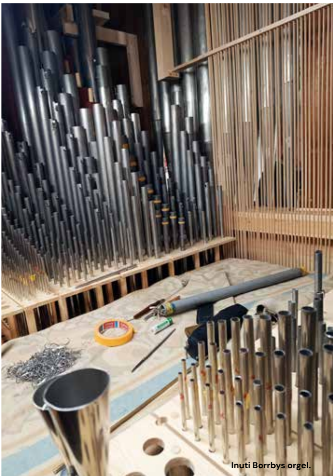
Inuti Borrby's orgel.