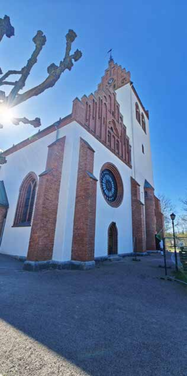
Hörby kyrka, nykalkad.