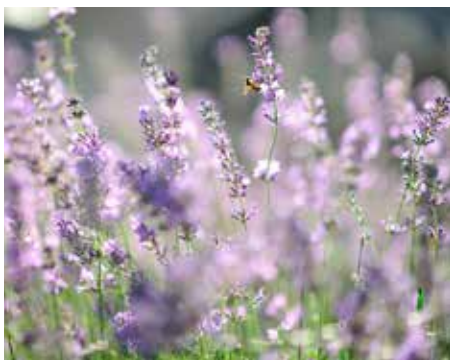
Vi firar Sommargudstjänst den 19 juli.

Söndag 5 juli – Apostladagen 15.00 GUDSTJÄNST vid kyrkoruinen