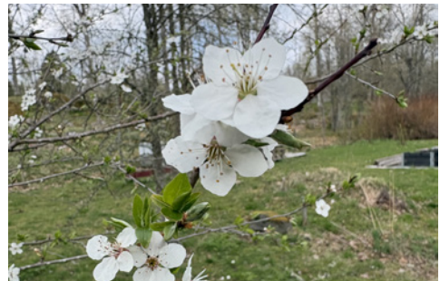
Blommande plommonträd i prästträdgården.

Kyrkobladet görs av: Voxtorps pastorat. Ansvarig utgivare: Elisabeth Hullfors. Redigering och tryck: Värnamo Ljuskopiering. Bilder/textbidrag voxtorps.pastorat@svenskakyrkan.se