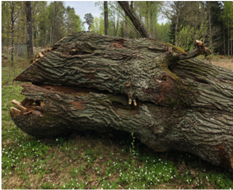
Nedtagna eken på framsidan och här ligger vid Voxtorpsgården. Den är över 2 m i diameter och tros vara minst 300 år. Den är "död" men ger nu liv åt tusentals insekter.

Efter en lång vinter kom så en vår som även den skulle visa sig bli lång. Det är som om det fanns något som höll den tillbaka, en tvekan för att gå vidare in i det okända. För ingen vare sig träden, grönskan, fåglarna, djuren eller människorna vet vad som skall komma. Spännande tycker en del av oss, oroande säger andra.