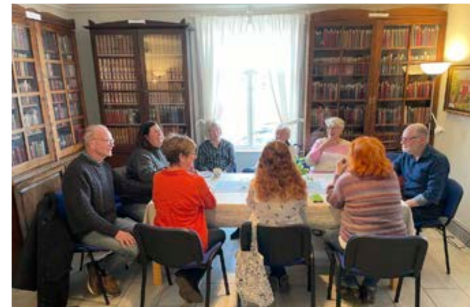
Trevlig samvaro kring bordet i biblioteket i Ängelsberg.