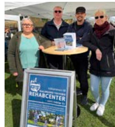
Personal från Malingsbo Tolvsbo Rehabcenter medverkade vid våryran i Fagersta den 15 maj.

unika och därför uttrycker vi sorgen efter en förlust på vårt eget unika sätt. Tanken är att alla som avslutar sin tolv månaders behandling på Malingsbo Tolvsbo Rehabcenter ska få med sig sorgebearbetningskursen som ett extra verktyg inför framtiden, säger Ulrika.