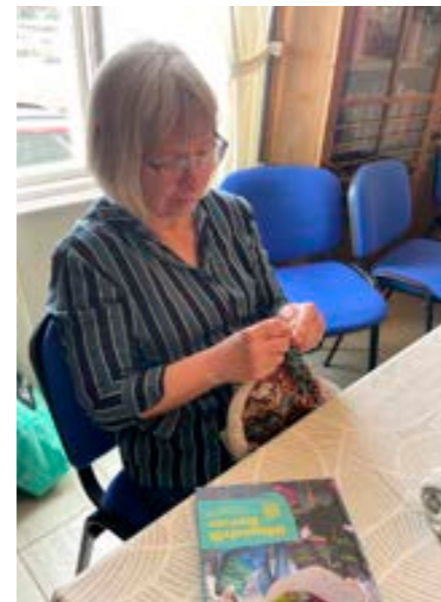
Biblioteksvårdare sticker snyggt.