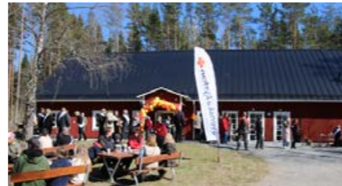
Många besökare kom till invigningen av Lejdet.