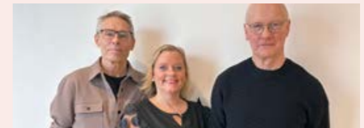
No Name 15 augusti – Edebo kyrka