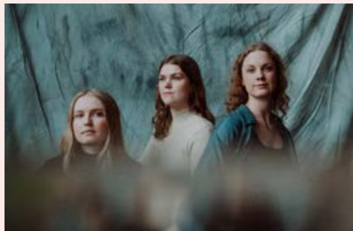
Tonå vokaltrio – 6 augusti Gottröra kyrka