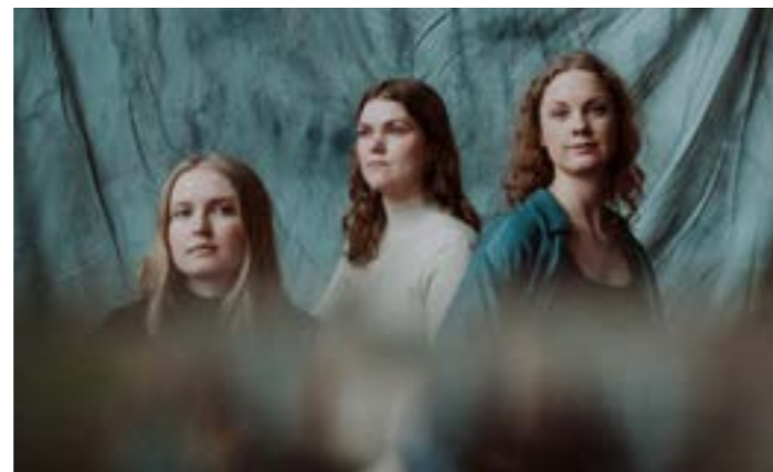
Tonå vokaltrio.

Efter gudstjänsten äter vi middag tillsammans i församlingshemmet.