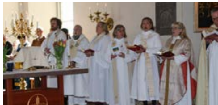
Bilder från visitationshögmässan i Fasterna kyrka.