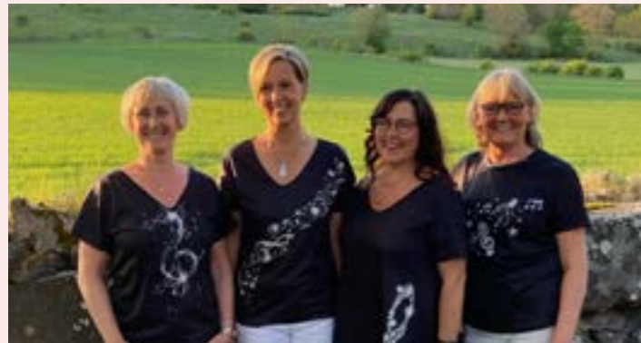
Visgruppen KIMM 4 juli – Husby-Sjuhundra kyrka