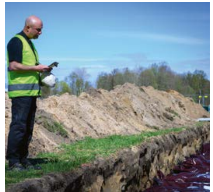
Varje fiktiv stupad får en enskild gravplats. En ceremoni hålls vid varje gravsättning.

Var rädd om dig i sommar - du är värdefull! Helén Uddén, kyrkoherde