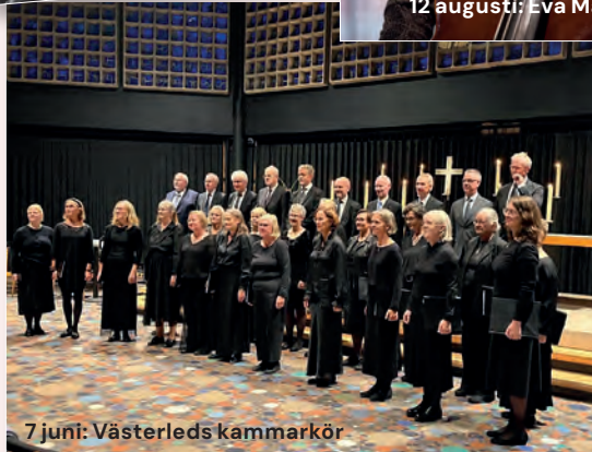
7 juni: Västerleds kammarkör