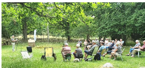
Gudstjänst i naturreservatet Kummelön.

Välkommen till dessa gudstjänster ute i det fria.