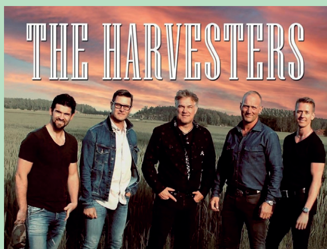
THE HARVESTERS SALEBY KYRKA

I sommar erbjuds ett rikt och varierat utbud på musik i sommarkväll i flera av våra kyrkor. Varmt välkomna!