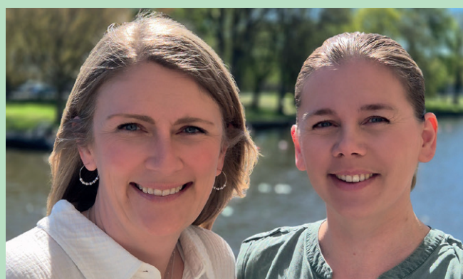
MARIA & JOSEFIN SÄVARE KYRKA