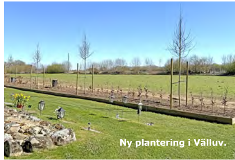
Ny plantering i Välluv.