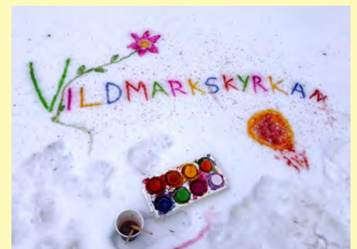
Färgglad text målade på skaren på snön.