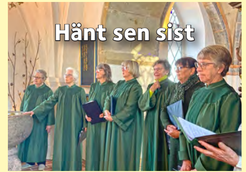
Hänt sen sist