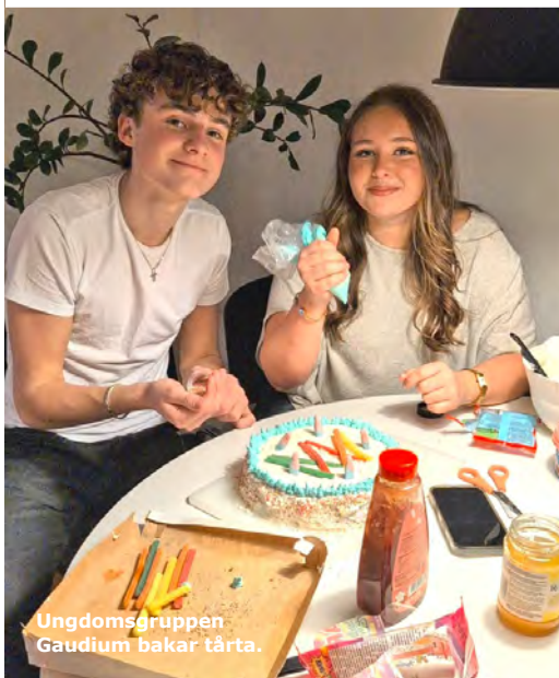
Ungdomsgruppen Gaudium bakar tårta.