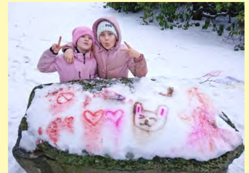
Barnen i "vildmarkskyrkan" målade i snön.