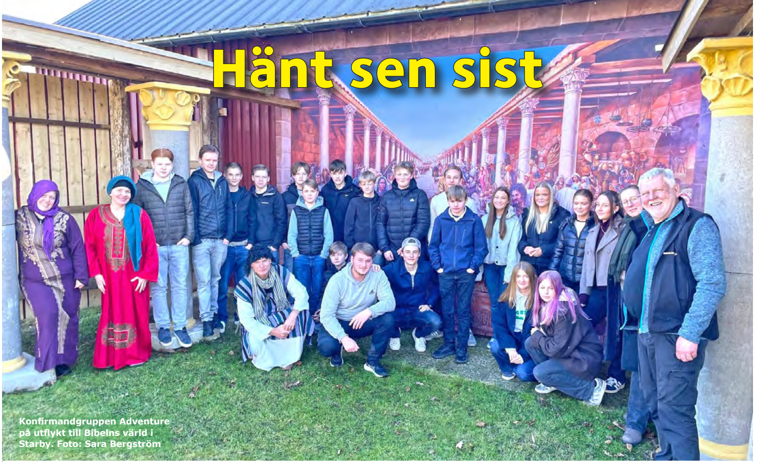
Konfirmandgruppen Adventure på utflykt till Bibelns värld i Starby.