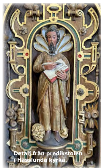
Detalj från predikstolen i Hässlunda kyrka.