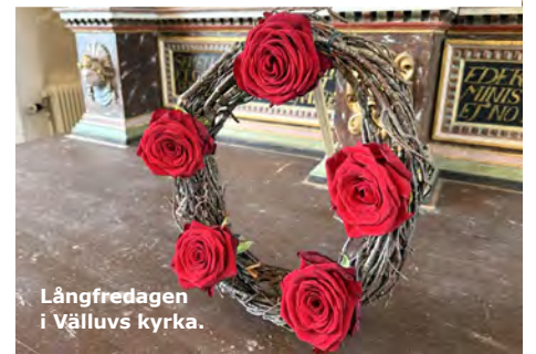
Långfredagen i Välluvs kyrka.