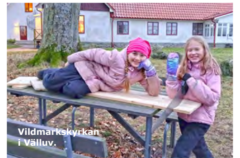
Vildmarks kyrkan i Välluv.