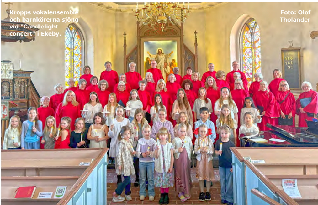
Kroppsvokalensemble och barnkörerna sjöng vid "Candlelight concert" i Ekeby.