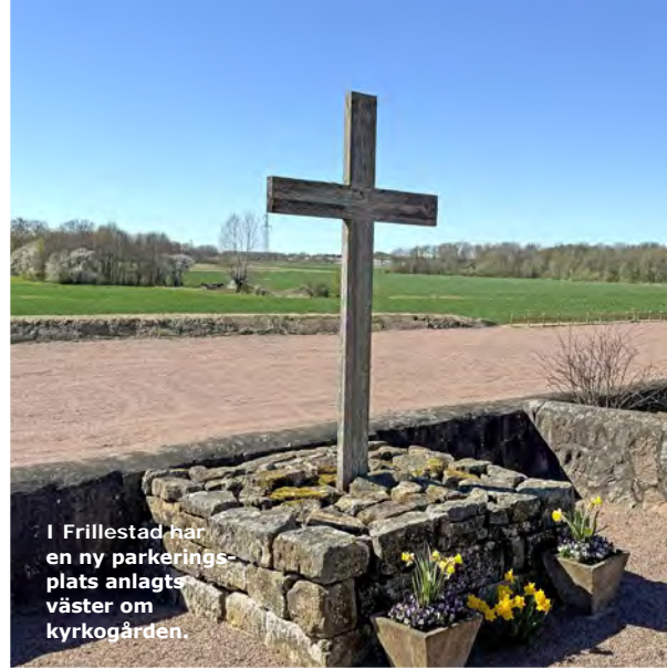
I Frillestad har en ny parkeringsplats anlagts väster om kyrkogården.