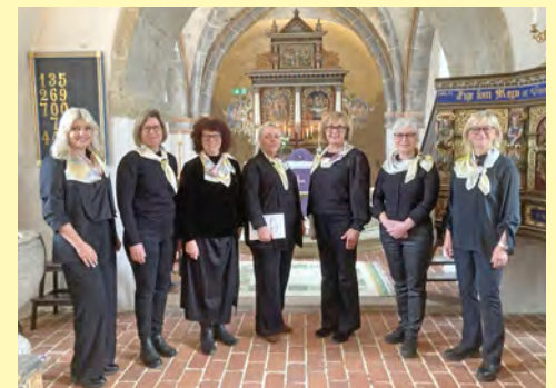
Körgruppen Donna voce sjöng i Välluv.