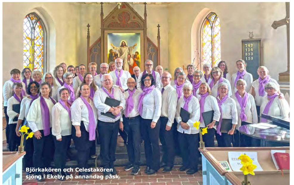
Björkakören och Celestakören sjöng i Ekeby på annandag påsk.