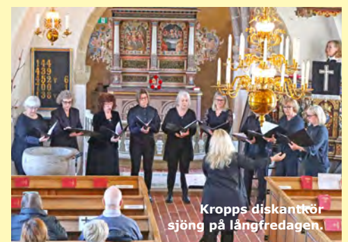
Kroppss diskantkör sjöng på långfredagen.