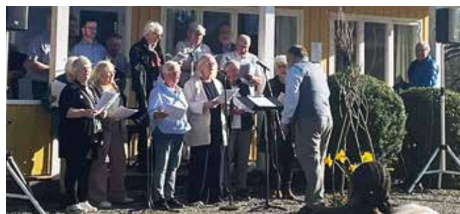
Ekumeniska Vårkören sjunger in våren under valborgsafton på Sjöholmen.