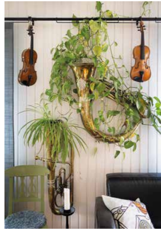
Instrument utgör också en väsentlig del i utsmyckningen av hemmet.

BLOTT EN DAG , Tryggare kan ingen vara, Bred dina vida vingar, Jag kan icke räkna dem alla. Listan över kända och älskade psalmer av Lina Sandell kan göras lång. Lägg till det att hon skrev tusentals dikter, väckelsesånger, mängder av andra texter och gjorde otaliga översättningar av sånger. Då tonar en bild fram av en ytterst produktiv och målmedveten poet och författare som starkt präglade svenskt kyrkoliv.