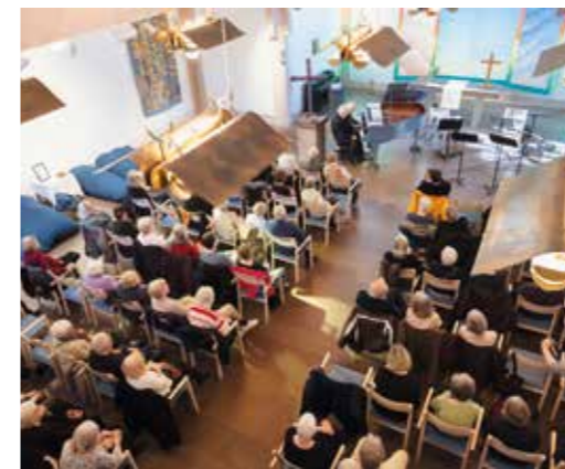
Fullsatt i Maria kyrka.

De firade med att spela fyrhändigt på Maria kyrkas ljusblå flygel. Kanske kan det vara ett tips för ett långt och lyckligt äktenskap – spela fyrhändigt.