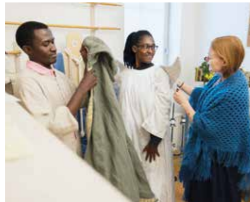
Påklädning inför påskspelen.

”I mässan i Tanzania är det normalt med upp mot 300 personer.