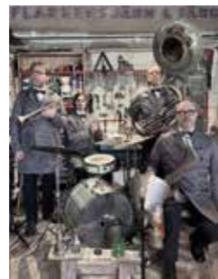
Flarkens Järn & Färg tolkar den svenska psalmboken Söndag 2 augusti kl 18 S:t Lukas kyrka

– Vi får se om jag hinner bli det innan jag dör.