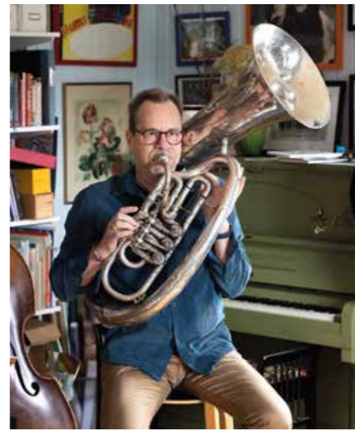
Sousafonen är en raritet från 1920-talet.