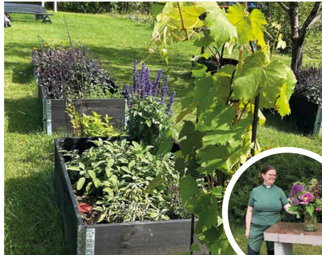
Pallkragar på plats.

”I klosterträdgården finns bra möjligheter att lära besökare i alla åldrar om örter och vad de kan användas till. Exempelvis teer med olika egenskaper.