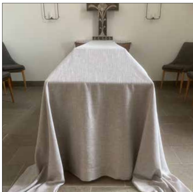
Bårtäcke för icke medlem i Svenska kyrkan.

I undantagsfall får begravningstjänst hållas för en avliden som inte tillhörde Svenska kyrkan om det finns särskilda skäl och är förenligt med den avlidnes önskemål. Beslut om detta fattas av kyrkoherden och en avgift tas då ut.