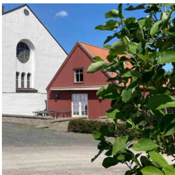
Kyrkstallet. 20 personer inkl personal.