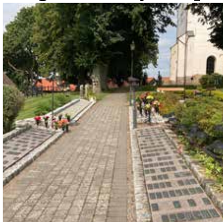
S:t Clemens kyrkogård