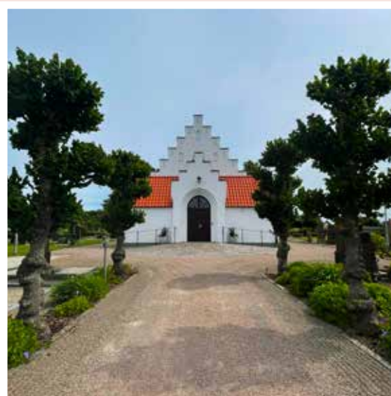
S:ta Gertrud kapell. 70 sittande gäster och 10 personal.