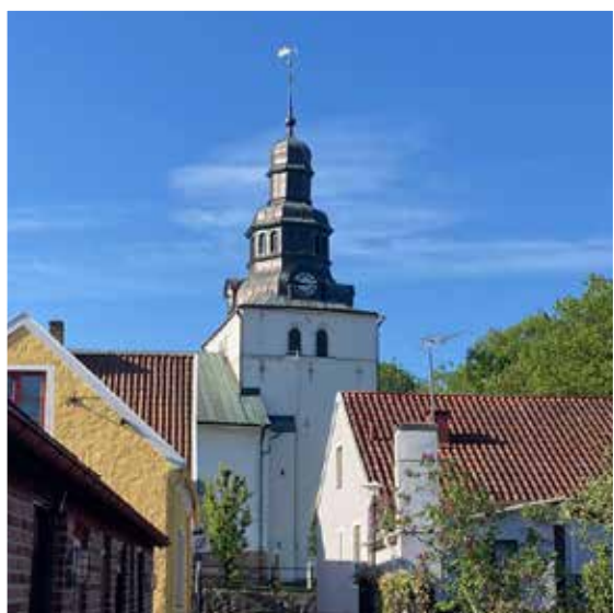
S:t Clemens kyrka. 550 personer inkl personal.