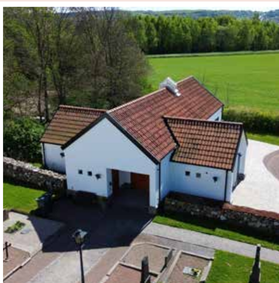
Annexet vid Skummeslövs kyrka. 30 personer inkl personal.