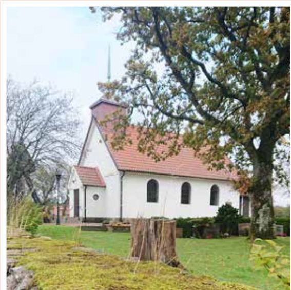
Skogaby kapell. 60 personer inkl personal.