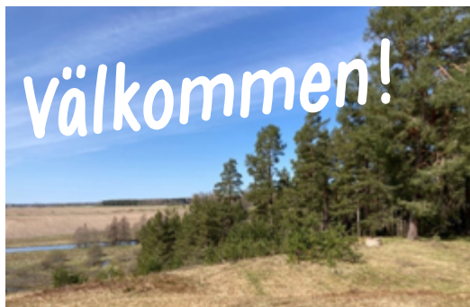
Pilgrimsbarn på tidigare upptäcksfärder...

Frågor? Annika 076-10 69 069 Carina 070-22 81 225