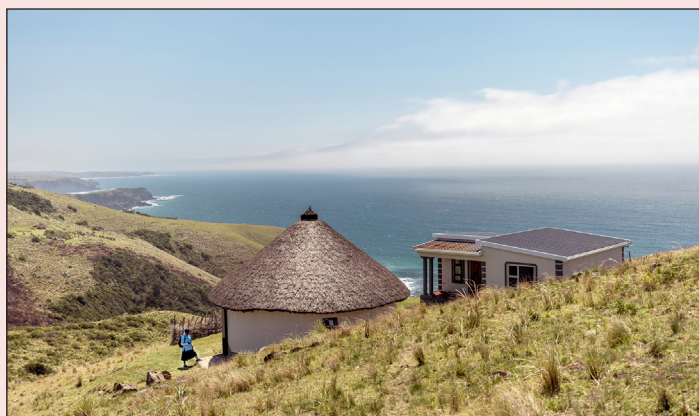
Thuletu och Ntombisiwe bor med en vacker utsikt men utan el, toalett eller rinnande vatten.

Innan mentormammorna kom till området fanns inte tillräcklig kunskap om hygien, nutrition och bakterier som sprids via förorenat vatten. Särskilt små barn dog i kolera, diarré eller andra sjukdomar – några av de vanligaste orsakerna till barnadödlighet.