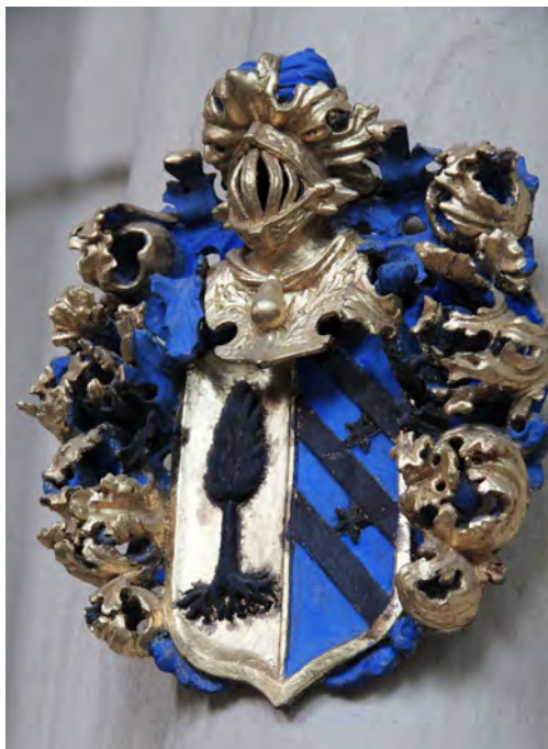
Släktvapen, så kallade huvudbanér, finns i många kyrkor.