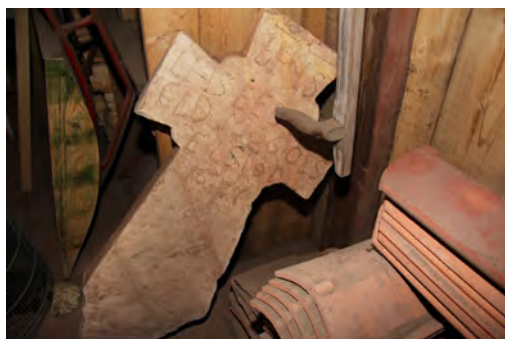
Många inventarier förvaras på annan plats än kyrkorummet.

Med genomtänkt förvaring för föremålen och en ändamålsenlig inventarieförteckning samt väl utarbetade rutiner, kan man upptäcka och förebygga skador i tid. Då ökar chanserna att skadorna åtgärdas innan de förvärras, vilket ger ekonomiska besparingar.