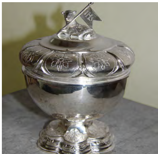
Den välputsade oblatasken finns så klart med i inventarieförteckningen.

Inventarieförteckningen är ett sätt att stärka den lokala historien för framtiden. Den är också en källa för forskning.