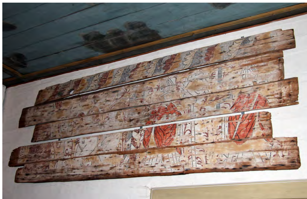
Fast inredning eller byggnadsdelar som demonterats räknas som lösa inventarier.