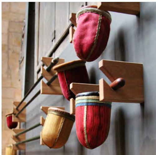
Den skonsammaste förvaringen för kollektåvar är att låta dem hänga horisontellt.