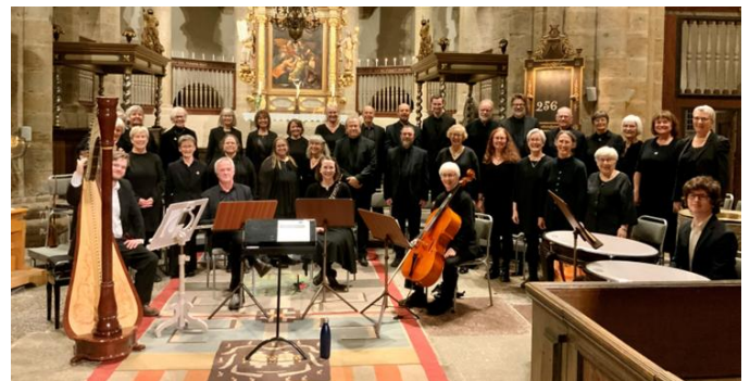
Falbygdens Oratoriekör vid konsert i Varnhems klosterkyrka hösten 2025.

Kören framför då Evensong, aftonsång, vilken i den Anglikanska kyrkotraditionen är en meditativ och stillsam kvällsgudstjänst med mycket sång.