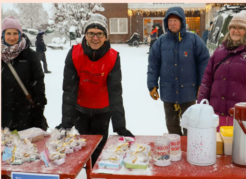
Julmarknad, Stensele församling