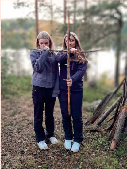
Konfirmationsarbete Lycksele församling