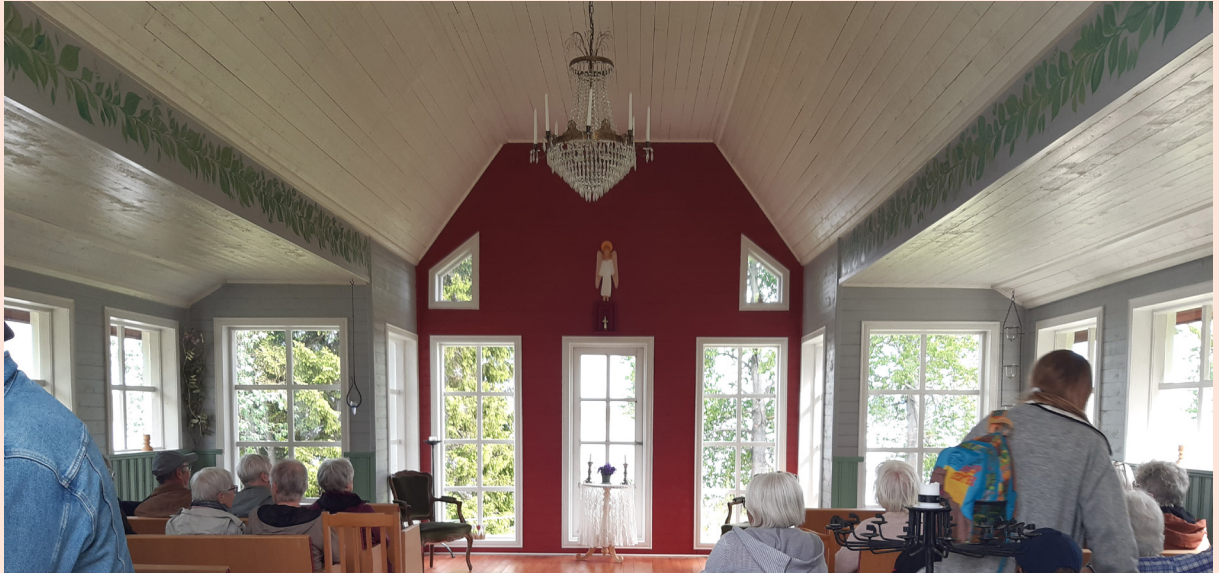
Församlingresa i juni till Svannäs gårdskyrka.