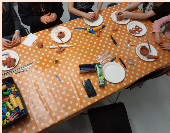
Pyssel med lera på After school

Med ett varmt mottagande och ett tydligt fokus på gemenskap fortsätter verksamheten att vara en viktig mötesplats för barn i bygden.