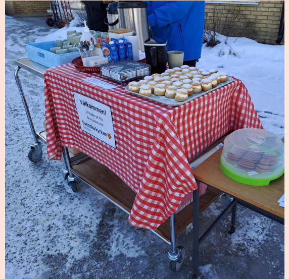
Fika på stående fot bjöd på minisemlor