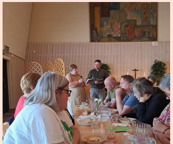
Sopplunch varannan tisdag i samarbete med Ichtu.