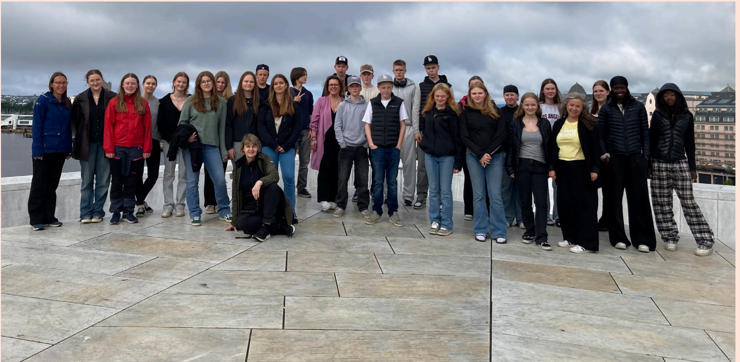
Gruppfoto på operahuset Oslo med konfirmanderna och Soulteens.