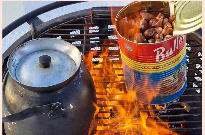
Korv och kaffe