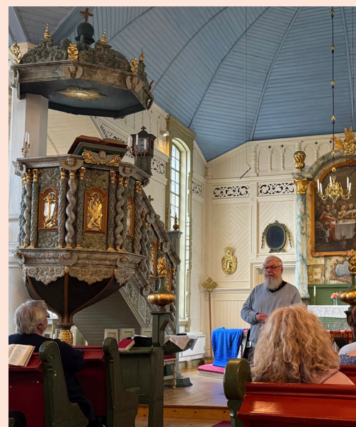
Resa till Arjeplog