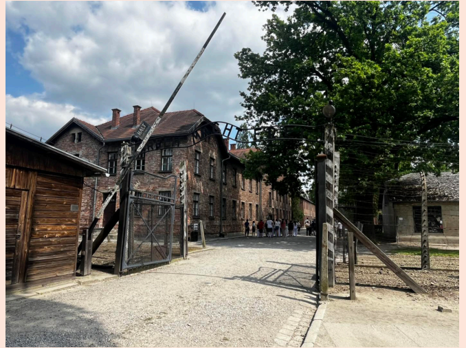
Konfarsa till Polen, Auschwitz