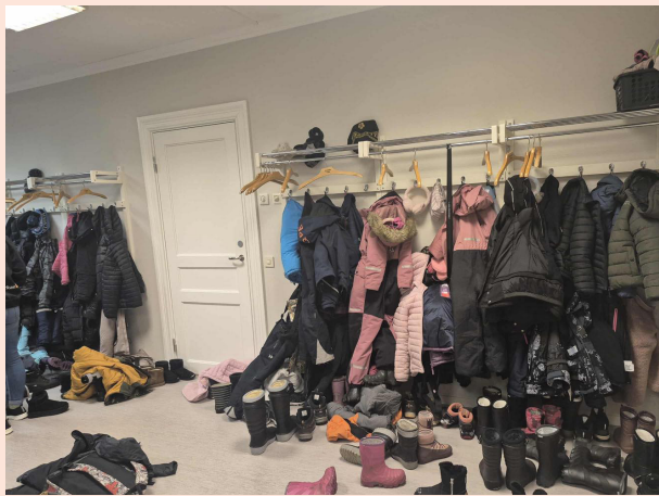
Hallen full på huset fullt