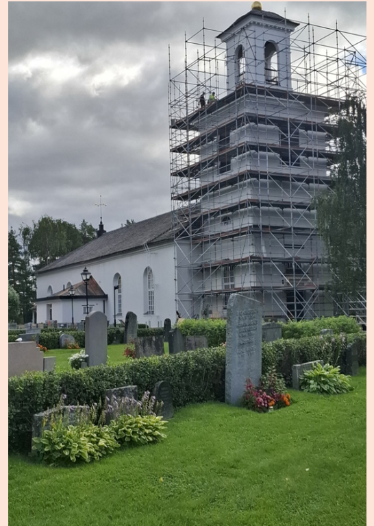
Renovering av Lycksele kyrka

Carport och kallgarage har byggts i Dorotea och Lycksele. I vårt hållbarhetsarbete har vi jobbat med att installera solpaneler på ett par fastigheter samt fortsatt med att trimma in våra anläggningar energimässigt. Planeringen framåt är att minska vårt energibehov och göra oss mindre beroende av köpt energi.