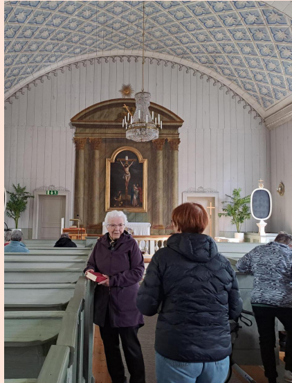
Utflykt till Örträsk.