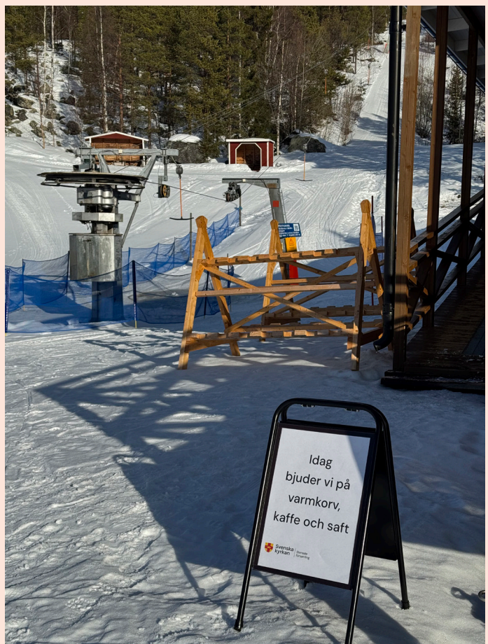
Slalombacken på sportlovet

Julottan i Åskilje blev en påminnelse om värdet av lokala traditioner och det enkla i att samlas – en stund av lugn och eftertanke mitt i juldagens firande.