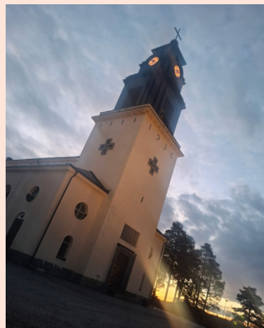
Åsele kyrka i solnedgång