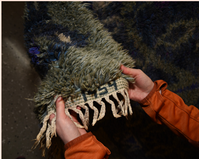
Bonad i Dorotea Kyrka, Foto Elvira Sten

Södra Lapplands pastorat har implementerat databasen Sacer för en enhetlig och digital registrering av kulturhistoriskt värdefulla föremål, vilket förenklar förvaltningen och kontrollen av inventarieförteckningar. Detta svarar mot tidigare brist på nationella riktlinjer, vilket lett till olikheter över landet. Sacer bidrar till ett bättre skydd och hantering av kyrkans arv, en tradition som sträcker sig tillbaka till 1571 års kyrkoordning. Projekt Sacer, ett initiativ för att höja kunskapen om och skyddet för dessa inventarier, inkluderar digitalisering av befintliga förteckningar och inventeringar, vilket markerar ett viktigt steg i att bevara kyrkans kulturarv digitalt.