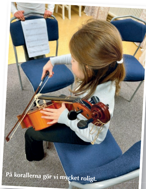
På korallerna gör vi mycket roligt.