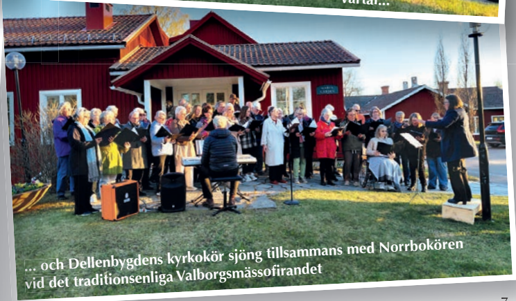
... och Dellenbygdens kyrkokör sjöng tillsammans med Norrbökören vid det traditionsenliga Valborgsmässöfirandet