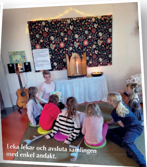
Leka lekar och avsluta samlingen med enkel andakt.