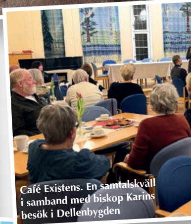
Café Existens. En samtalskväll i samband med biskop Karins besök i Dellenbygden