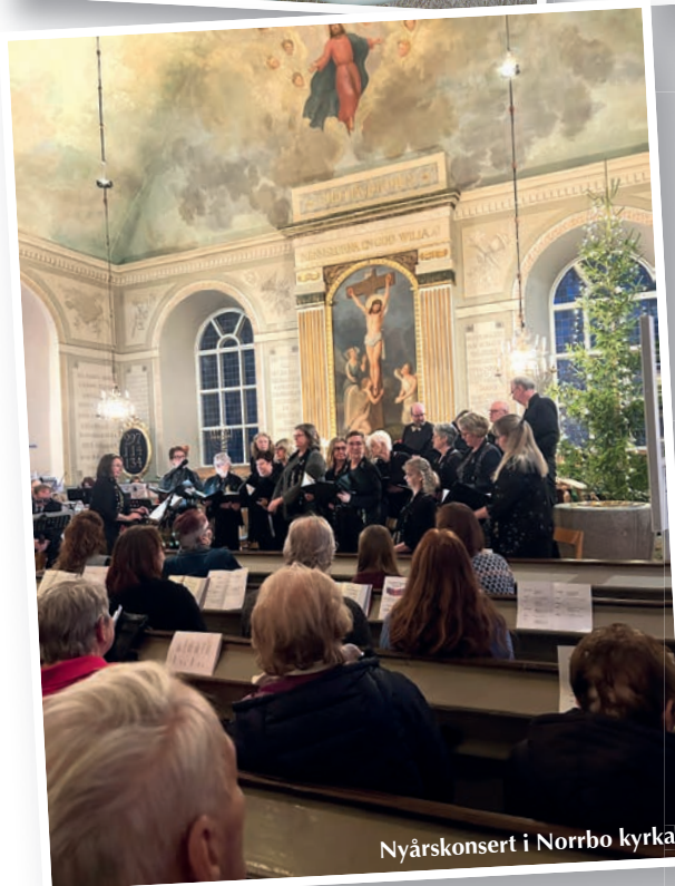
Nyårskonsert i Norrbo kyrka