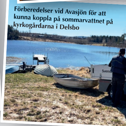
Förberedelser vid Avasjön för att kunna koppla på sommarvattnet på kyrkogårdarna i Delsbo