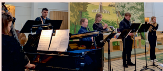
Blåsensemblen vid festhögmässan.