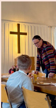
Biskop Åsa besökte Seskarö och träffade öbor.