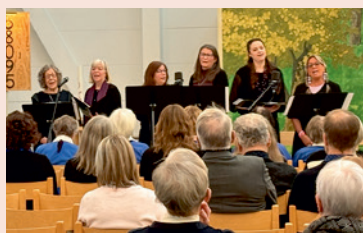
Korister ur Världens kör.