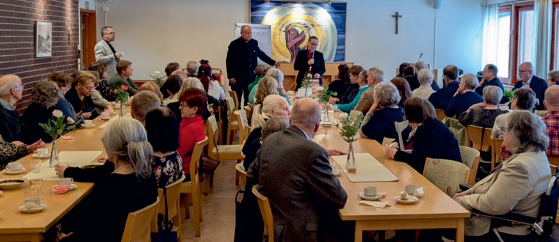
Visitationstal av biskopen inför fullsatt församlingssal vid kyrklunch.