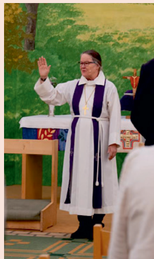
Biskop Åsa på morgonmessa.

OM BISKOPSVISITATION Att besöka församlingar genom biskopsvisitationer är en del av biskopens uppdrag. Det innebär att biskopen möter församlingsbor, anställda och förtroendevalda för att lyssna, ge råd och inspiration samt utöva tillsyn. Visitationerna sker med jämna mellanrum i alla 55 församlingar inom stiftet.