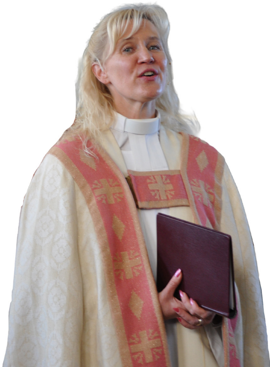
Bild från Kyrkoherdeinstallationen 27/9 2015