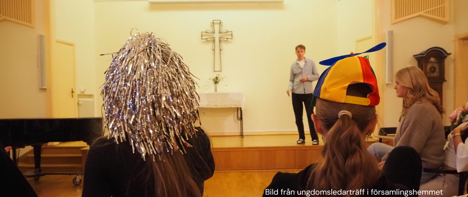
Bild från ungdomsledarträff i församlingshemmet

Jag känner att jag kan vara mitt riktiga jag när jag är här. Det finns en stor spridning av olika människor och det är roligt att hänga med alla.