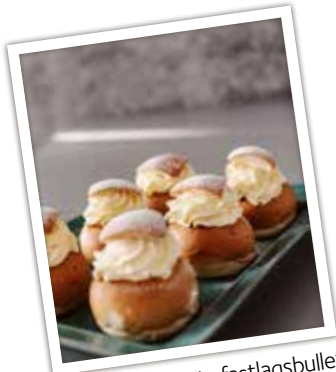
"Fastan - mer än fastlagsbulle". Skogaby kapell på Ro & Tro gudstjänst.