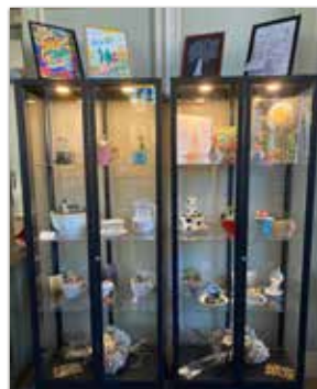
Medlemmarna får ställa ut sina skapelser i vitrinskåpet i kyrkan. Välkommen att titta!