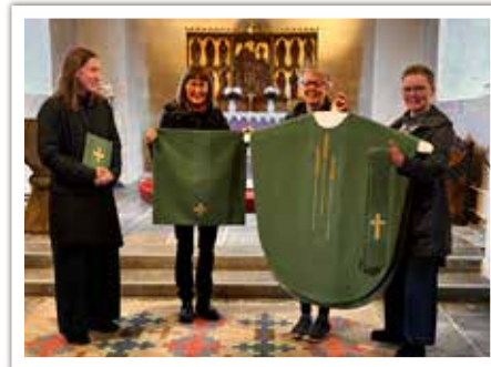
Nya textilier till Skummeslövs kyrka. Ett längre inlägg kommer om detta till hösten.