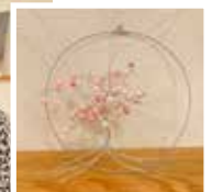
Ingamaj skapar ett träd med ståltråd och pärlor.