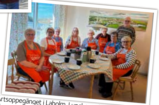
Årsoppegänget i Laholm. Luncherna är mycket uppskattade och det har varje gång varit över 100 gäster i församlinghemmet i Laholm. Fantastiskt bra jobbat!