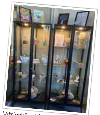
Vitrinskåpet i S:t Clemens är påfyllt med nya alster.