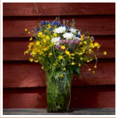
Varmt välkommen till Laholms pastorat!