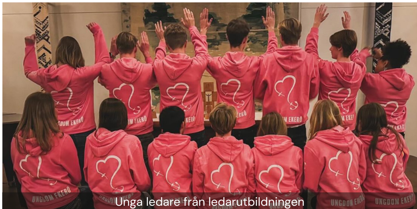
Unga ledare från ledarutbildningen

Taizé bedöms fortsatt ha ett stort värde som mötesplats och andlig erfarenhet. Inför kommande år har samarbete etablerats med annan församling i syfte att skapa hållbara förutsättningar. Tidigare erfarenheter visar att deltagandet bidrar till fördjupad tro, gemenskap och internationella perspektiv.