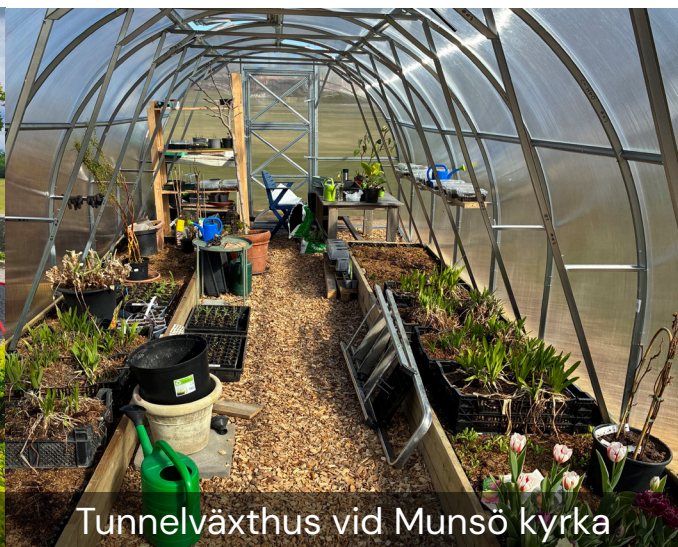
Tunnelväxthus vid Munsö kyrka