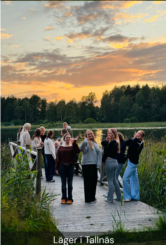
Läger i Tallnäs