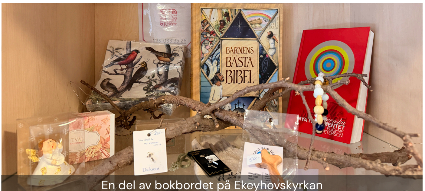
En del av bokbordet på Ekeyhovskyrkan

Inom ramen för det ekumeniska samarbetet finns också arbetet i Kyrkornas secondhand och Café Mälarö.