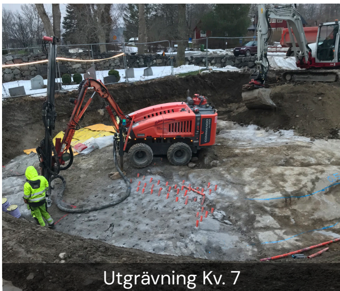
Utgrävning Kv. 7