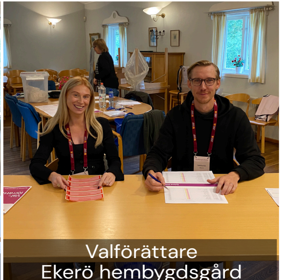
Valföretare Ekerö hembygdsgård