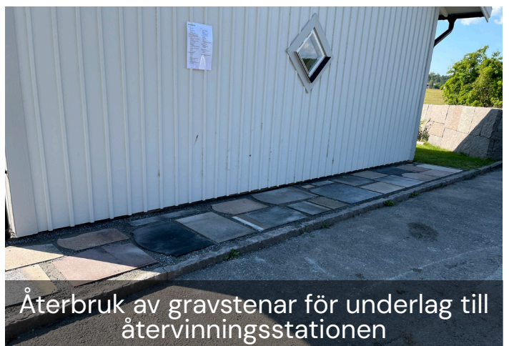
Återbruk av gravstenar för underlag till återvinningsstationen