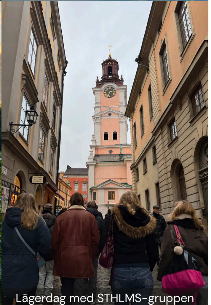
Lägerdag med STHLMS-gruppen