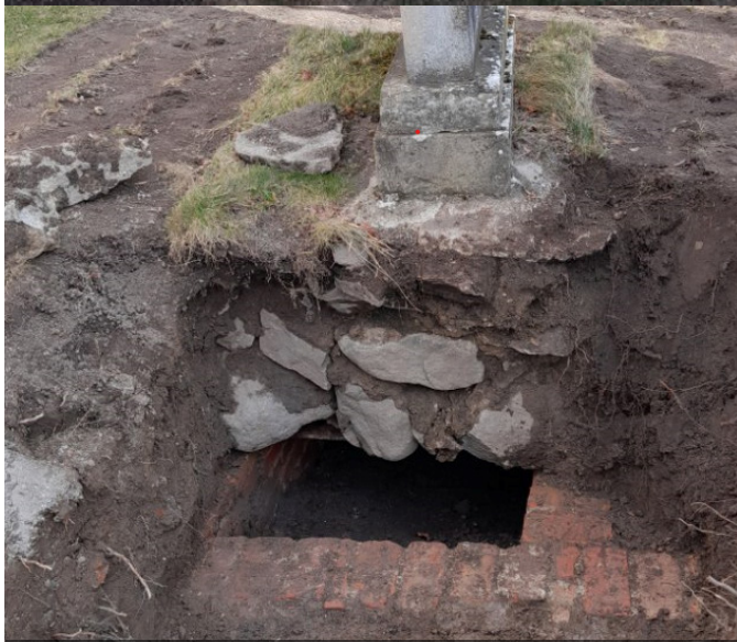
Slukhål under reparering