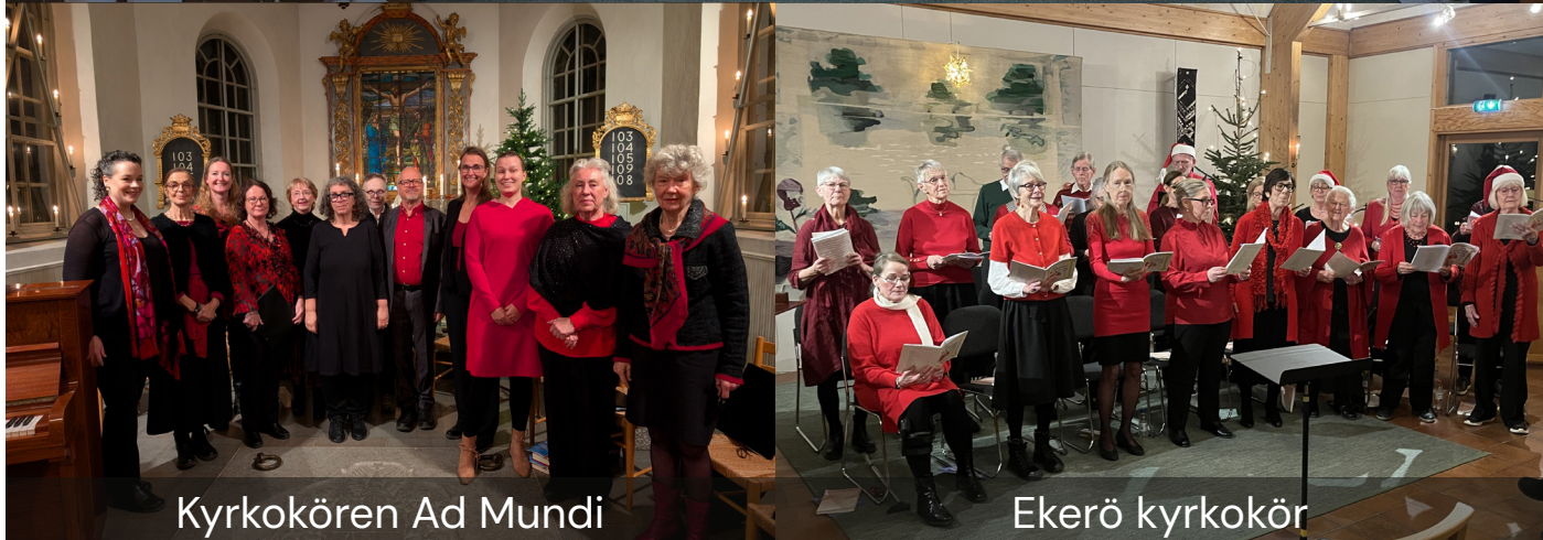
Kyrkokören Ad Mundi