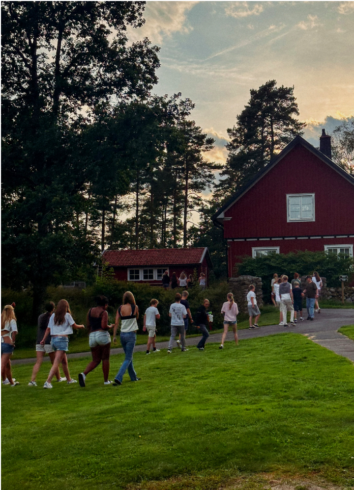
Lägergård i Tallnäs