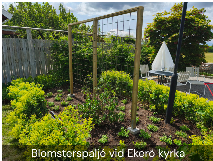
Blomsterspaljé vid Ekerö kyrka

Utifrån beredskapsperspektivet behöver våra ekonomibyggnader vara anpassade för att fungera under svåra störningar. Kommande år så behöver vi budgetera för högre kostnader och utrustning för att våra lokaler ska kunna vara ändamålsenliga under svåra omständigheter.