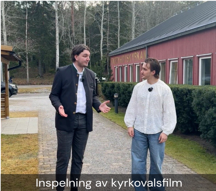
Inspelning av kyrkovalsfilm