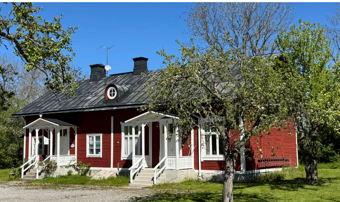
Kyrkskolan. I dag är det privatbostad och lokal för kyrkliga syföreningen.