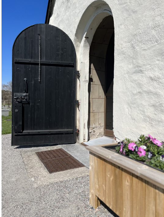
Ingången till vapenhuset.

Vapenhuset tillkom på 1400-talet. Det byggdes framför den södra ingången täckt med ett tunnvalv av tegel. Ett långhusfönster åt söder byggdes då delvis för, men eftersom de ville ta vara på så mycket som möjligt av fönstrets dageröppning har vapenhuset en något orgelbunden placering.