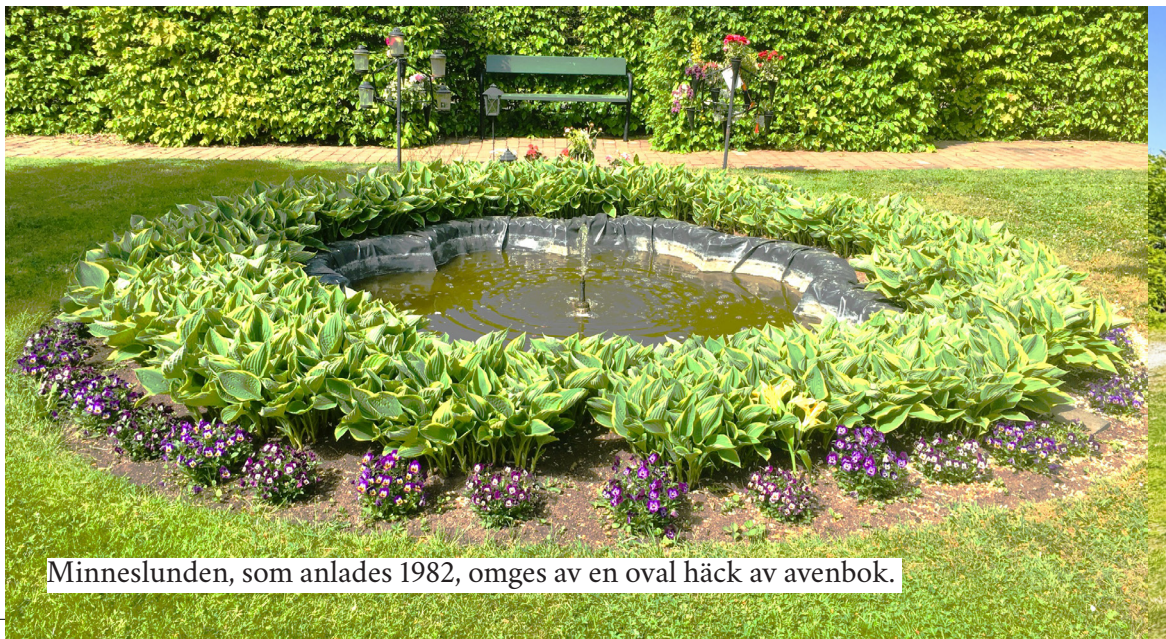
Minneslunden, som anlades 1982, omges av en oval häck av avenbok.

Det har funnits två stigluckor från 1600-talet; en i söder och en i norr. Den norra kan möjligtvis ha varit på nuvarande huvudingångens plats. En av stigluckorna omnämns 1603 i samband med en reparation och den andra uppfördes 1650. Den södra stigluckan benämns som förfallen 1674 och reparerades ett flertal gånger. Utseendet på stigluckorna är okänt.