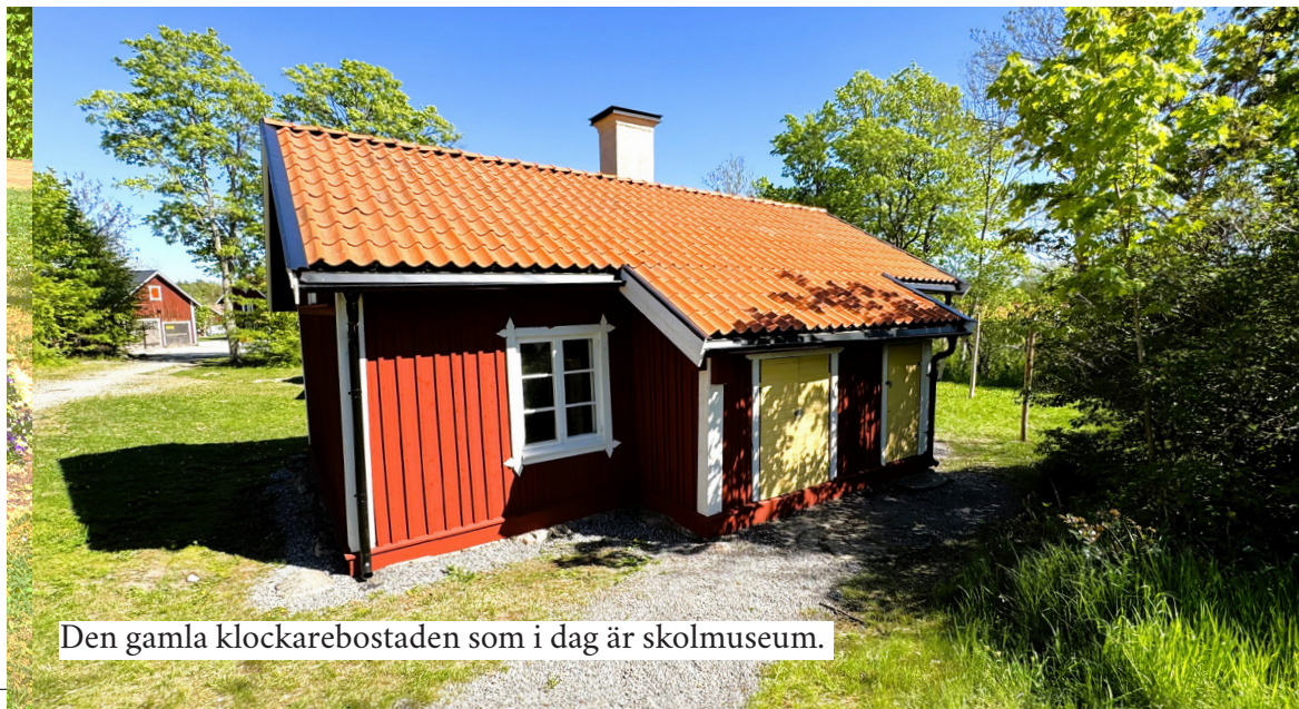
Den gamla klockarbostaden som i dag är skolmuseum.