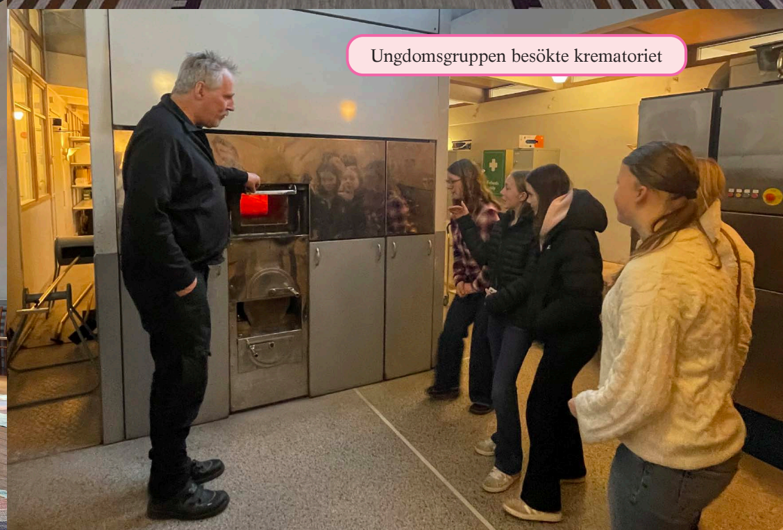
Ungdomsgruppen besökte krematoriet