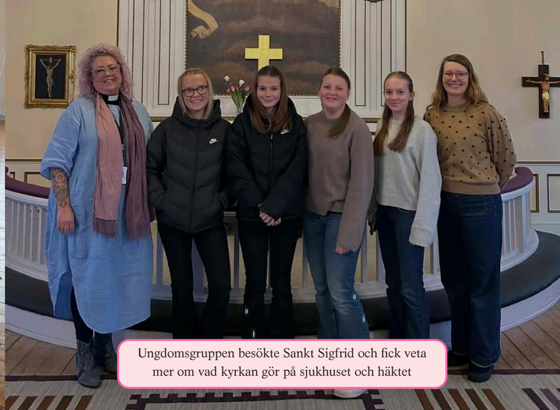
Ungdomsgruppen besökte Sankt Sigfrid och fick veta mer om vad kyrkan gör på sjukhuset och häktet