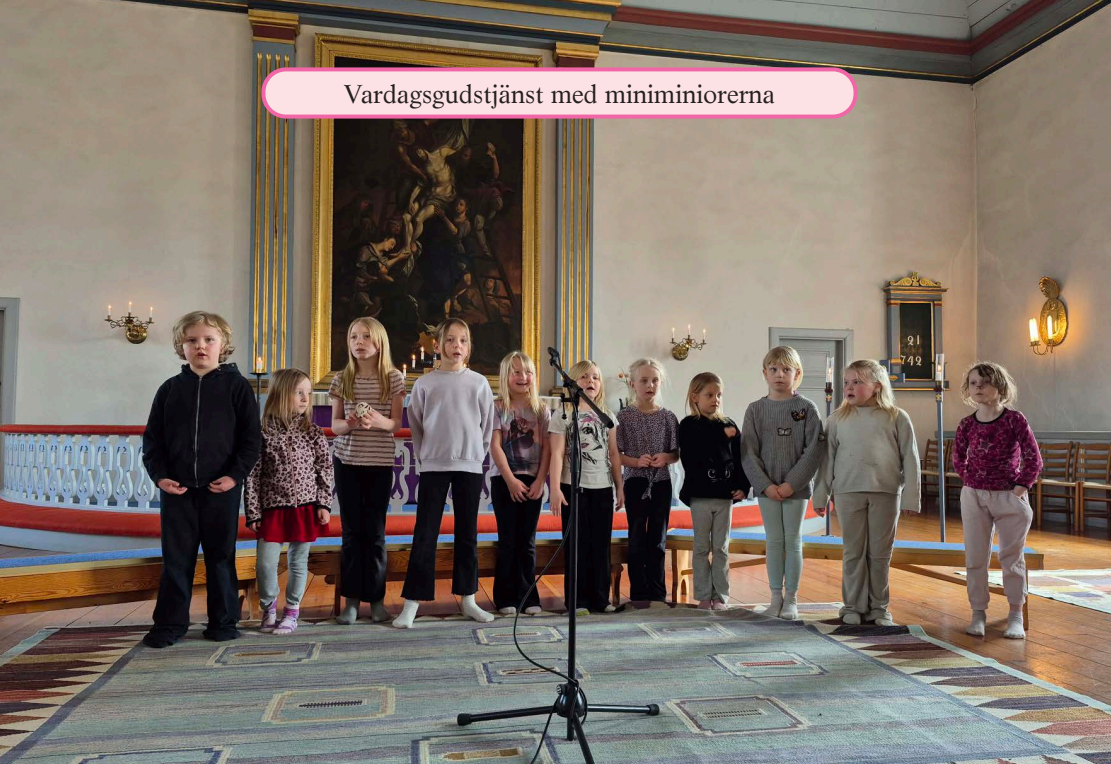
Vardagsgudstjänst med miniminiorena