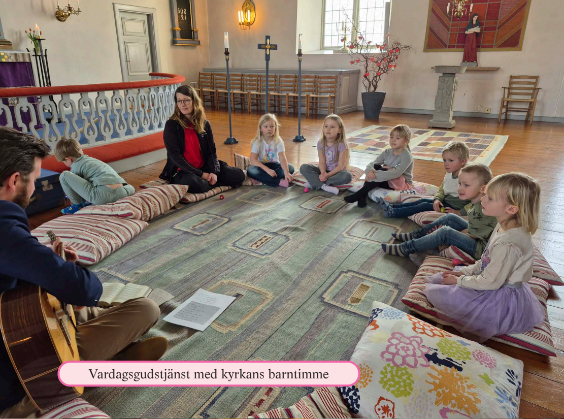
Vardagsgudstjänst med kyrkans barntimme