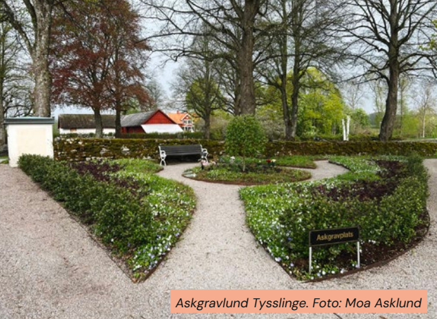
Askgravlund Tysslinge.