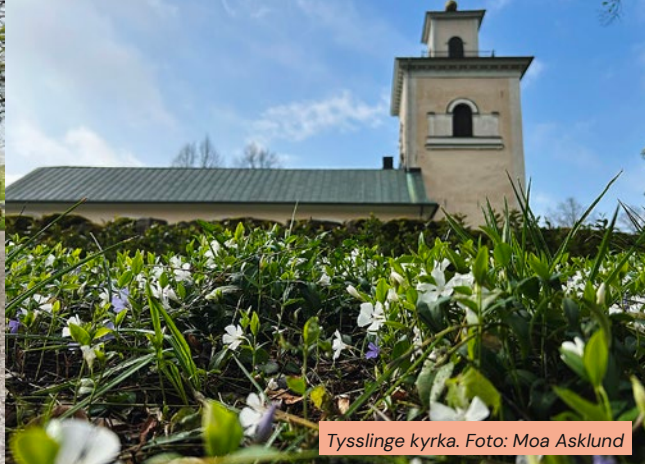
Tysslinge kyrka.