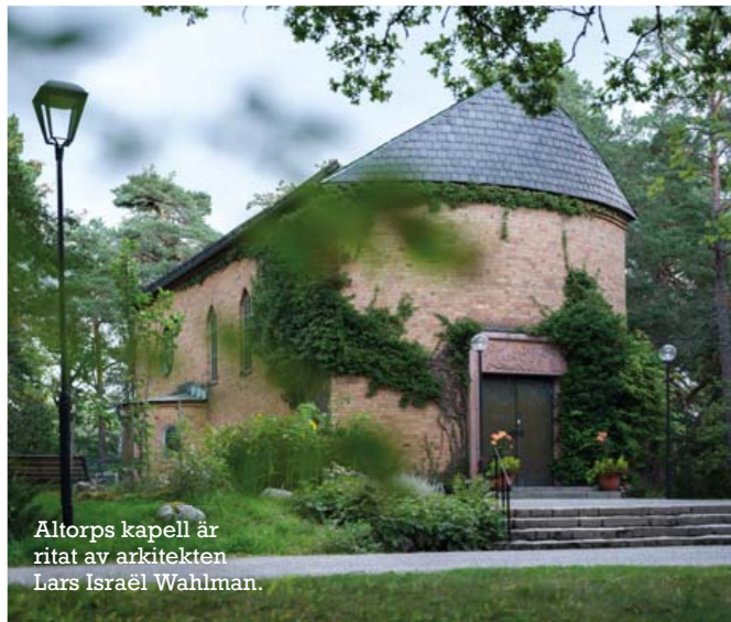
Altorps kapell är ritat av arkitekten Lars Israël Wahlman.