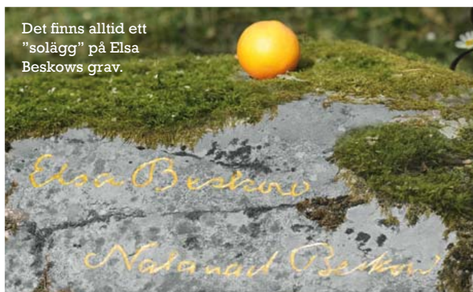
Det finns alltid ett "solägg" på Elsa Beskows grav.