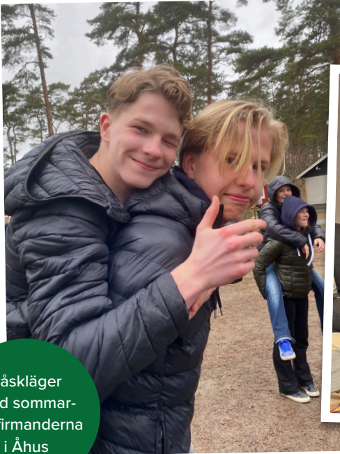
Påskläger med sommar- konfirmanderna i Åhus