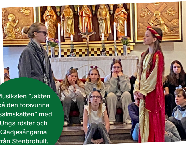
Musikalen "Jakten på den försvunna psalmskatten" med Unga röster och Glädjesångarna från Stenbrohult.