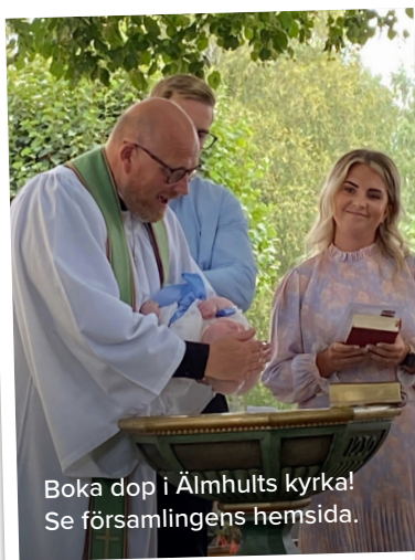
Boka dop i Älmhults kyrka! Se församlingens hemsida.