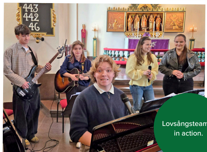
Lovsångsteamet in action.