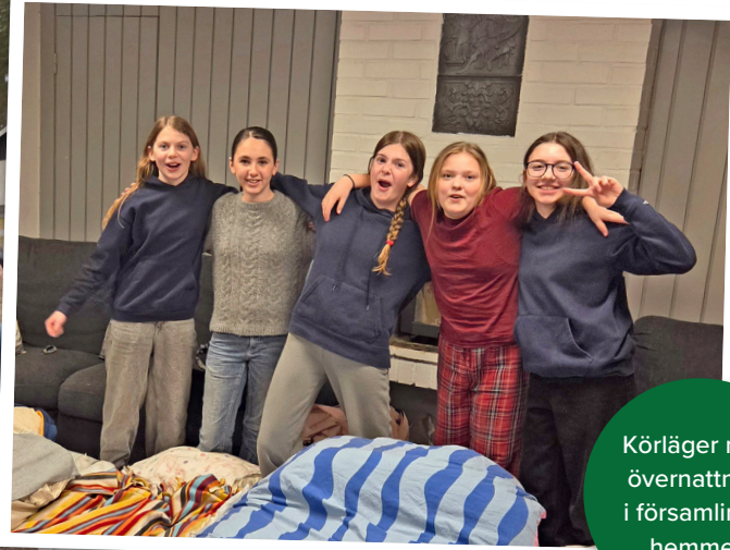
Körläger med övernattning i församlings- hemmet.