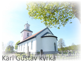
Karl Gustav kyrka