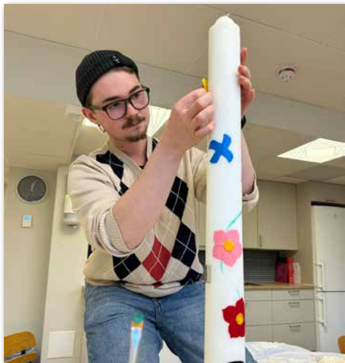
Jag gör årets påskljus till Nybro kyrka

Under mitt år som trainee har jag fått se och uppleva det mesta kyrkan har att erbjuda. Från att leda årets konfirmander till Ansgarskören. Jag har varit runt på olika gemenskapscaféer, varit och är gudstjänstvärd, spelat in andakter på Radio Nybro och mycket mer. Jag har fått en helt annan inblick på kyrkan som arbetsplats och hur de olika profilyrkena jobbar. Innan hade jag bara varit aktiv i barn och ungdomsverksamheter och trott "finns det något mer", men jag ser nu att jag hade ganska fel. Sen gör jag inte det här själv såklart. I år har det varit en riktig traineeboom med hela 26 traineer. Dessa är utsprida i hela stiftet, från Jönköping norr till Älmhult i söder och till Kalmar i öst och allt där emellan. Vi träffas alla på skolan cirka en gång i månaden, men vi har också fått ihop träffar utanför arbetstid.