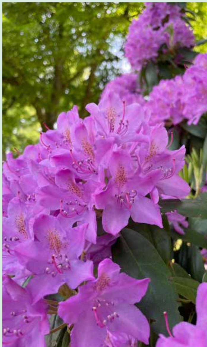
Madesjö kyrkogård

Vill man besöka Sveriges finaste ska man såklart besöka Sofiero slott, men annars kan man njuta av dess blommor även på Skogskyrkogården i Nybro.