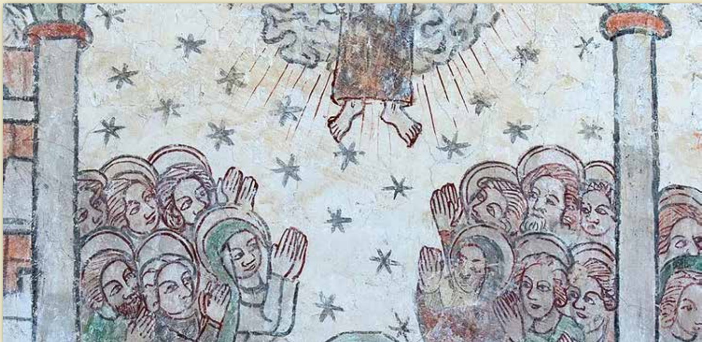
Kalkmålning, Eke kyrka, Gotland.

När jag vaknar på Kristi himmelfärds dag ställer jag mig ibland frågan om varför jag blev präst ...! Jag vill ju också vara ledig en helgdag nån gång och ge mig ut och fiska ... Men när jag väl har suttit på den gamla fina kapellplatsen i Örsjö eller vid den vackra minneslunden med glas-