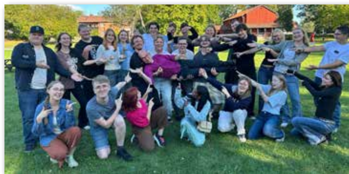
Traineegruppen i Växjö stift lyfter biskop Fredrik