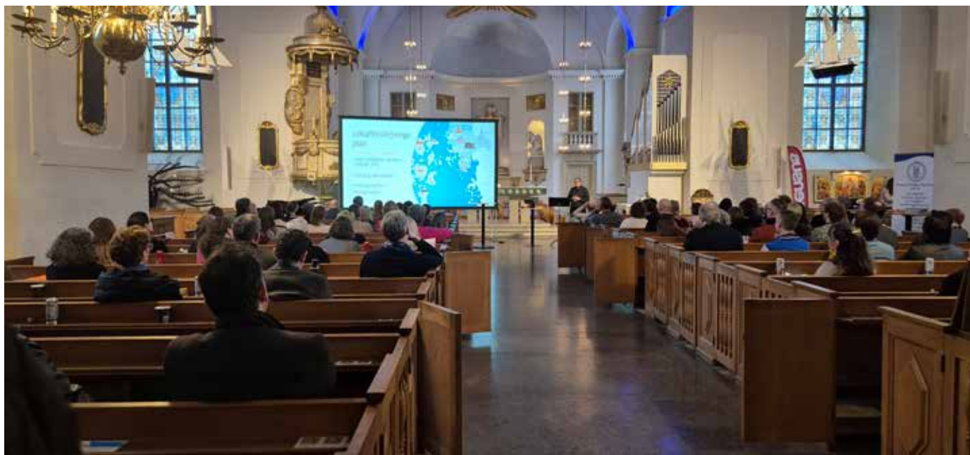
130 deltagare tog del av kyrkoherdeperspektivet i arbetet med att få fler att stanna på pallen.

att stanna kvar efter körövningen och testa på orgel. Vi byggde alltså på det vi redan hade. Det var andra steg för att lyckas .