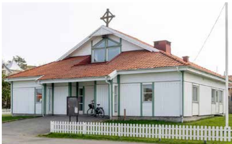
Asperö kyrka.

intresset var alltså så stort. Då kände jag ansvaret att vi som kyrka ska svara på det behovet som finns.