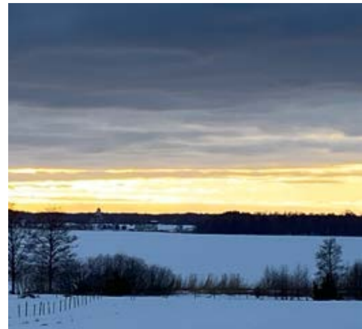
Utsikt mot Fasterna.