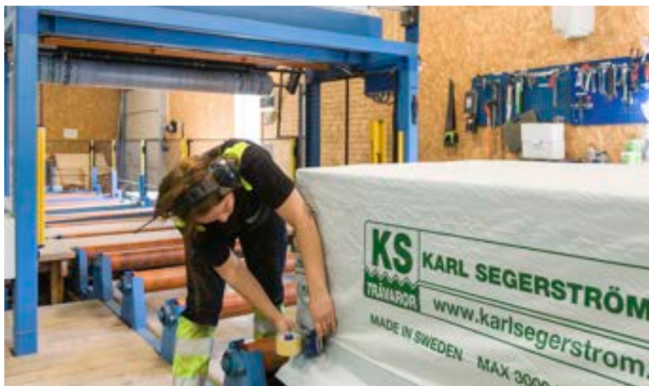
Virke packas vid sågen i Åvestbo.