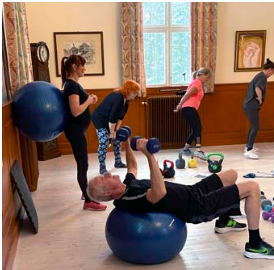
En pilatesboll kan användas på flera sätt.