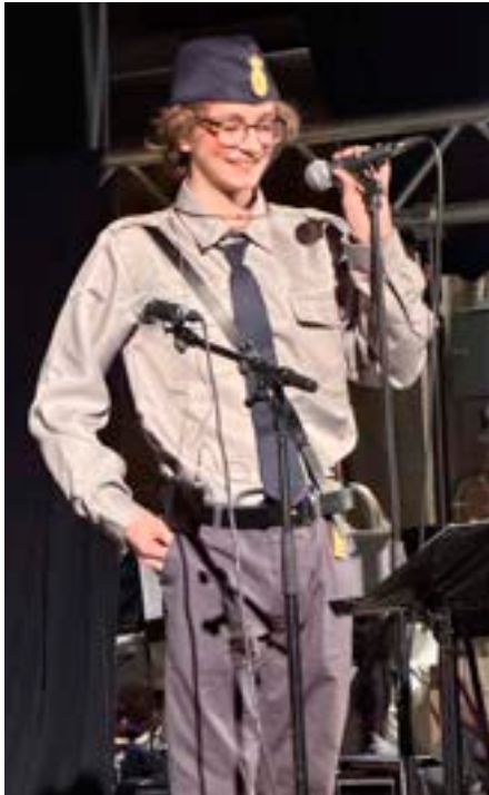
En polis och en konduktör. Flera av eleverna i klassen har framträdande roller i "Tågmysteriet".