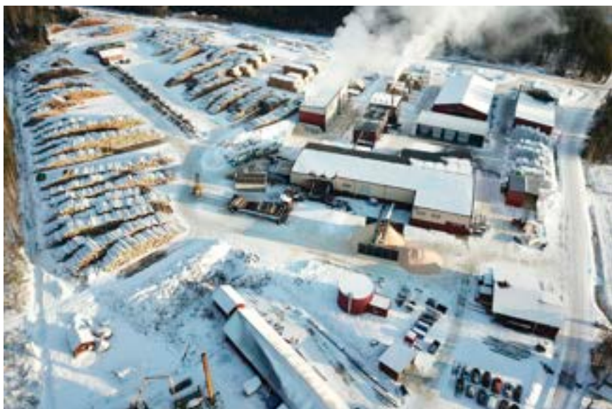
Flygbild över sågverket i Åvestbo.

Gnosjöandan: Begreppet gnosjöandan har formats utifrån den flit och företagsamhet som anses utmärka invånarna i området Gnosjö i västra Småland. I gnosjöbygden sägs det råda en speciell anda av framgångsrikt företagande, allra främst i form av ett stort antal småföretagare, hög sysselsättning och ett aktivt civilsamhälle.