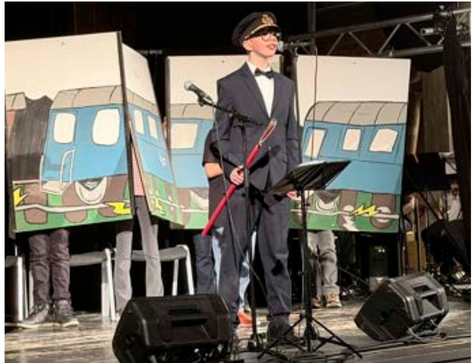
Bilderna är från musikalen "Tågmysteriet" som eleverna i Lindgårdsskolans år 6 spelade upp för andra elever i Fagersta veckan före jullovet.

vilket var tur. "Man tar vad man har, kan själv..." Nu har själva bristen på pengar bidragit till ett scenografiskt uttryck som i mitt tycke, harmonierar väl med böckernas illustrerade tvådimensionella uttryck och ofta förstärker komiska situationer med en låg budget. Sedan föddes idén att ändra i låtarna så att eleverna lärde sig mönster, riff, basgångar etc. som passar låtar som de ska spela på högstadiet, och det blev en extra utmaning. Sen har det liksom rullat på. Det blev en metod för mig, ett koncept.