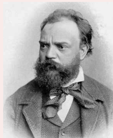
Antonín Dvoráks Stabat Mater 29 mars i Västerledskyrkan.