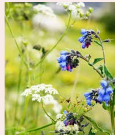
Förklädd Gud av L-E Larsson 19 april i S:t Ansgars kyrka.