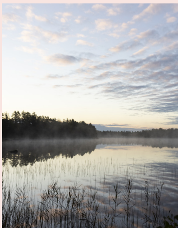
Nordiskt ljus med kammarkören i Västerledskyrkan 12 oktober.