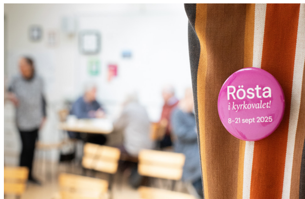
Träffa nomineringsgrupperna i Församlingshuset i Alvik.

Välkommen hälsar Valnämnden i Västerleds församling.