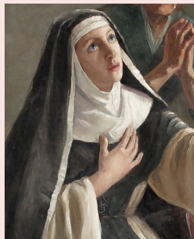
Flyga högt. Musikal om heliga Birgitta i S:ta Birgitta kyrka 12 oktober.