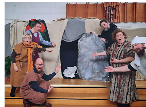
Graven är tom! Vad betyder det?

Sedan julen 1995 och påsken 1996 har vi i DUVAN i Kolbäck haft jul- och påskvandringar. I 30 år har barn från Kolbäck fått uppleva julens och påskens budskap i form av oss glada amatörskådespelare och huset omgjort med olika scener ur bibelns berättelser. De har fått möta Maria och Josef, åsna, herdar, vise män, änglar, lärjungar, Pontius Pilatus och många, många fler. Från början var det ett samarbete mellan Missionskyrkan i Kolbäck och Kolbäck-Säby församling, ett samarbete som fortsatte även sedan Missionskyrkan i Kolbäck gick upp i Hallstahammar.