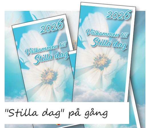
"Stilla dag" på gång