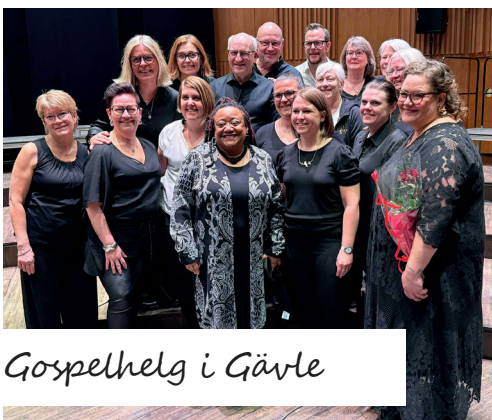
Gospelhelg i Gävle