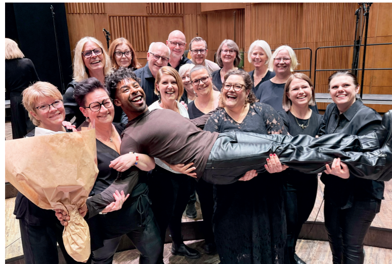
John Lundvik bärs upp av S:t Lars gospel.

Så har februari månad passerat för detta år, och därmed även en av årets roligaste händelser, om man frågar mig: Gävle Gospelfestival. Det är en festival dit man kan anmäla sig att vara med i masschoir, en stor gospelkör bestående av ca 350 personer, som samlas och repeterar tillsammans under en hel lördag för att sen ge en konsert på söndagskvällen. Detta tillsammans med professionellt komp och två gästartister.