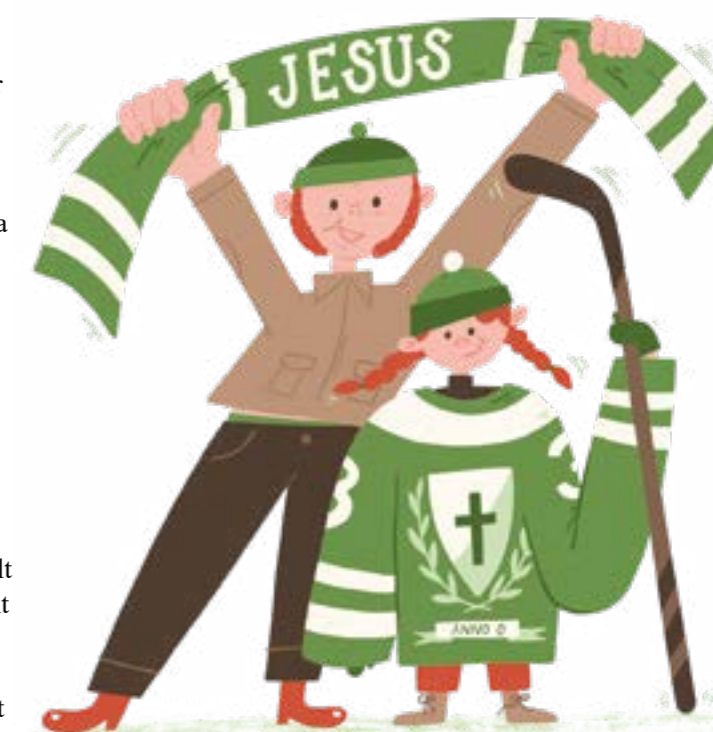
Illustration: Saga Bergebo