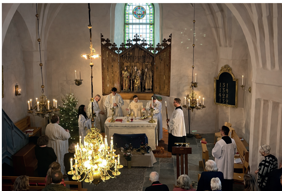
Bild: Altaret med celebrant och ministrarer i Uppsala-Näs kyrka.

Bilderna är från Trettondedag jul i år, 2026. Det går inte att rättvist sammanfatta åren som präst i Balingsta. Vid kyrkkaffet efter avskedspredikan