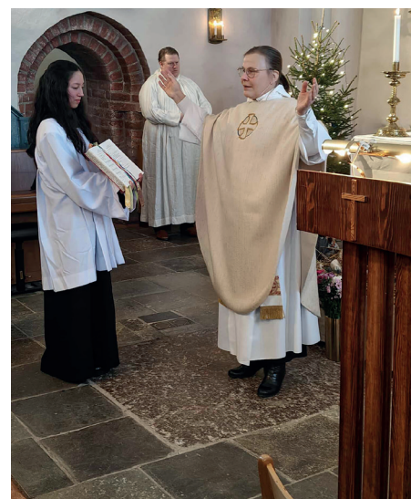
Bild: B-K ger Guds välsignelse till församlingen i Uppsala-Näs kyrka.