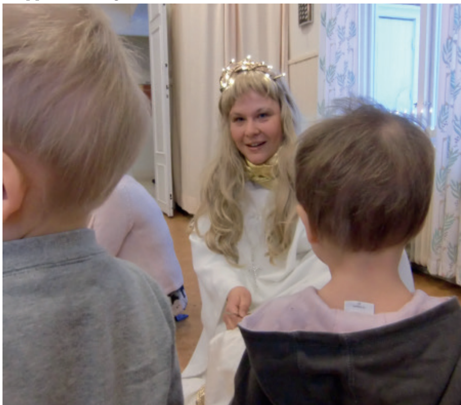
Bild: BK på öppnaförskolan efter julspel 2010